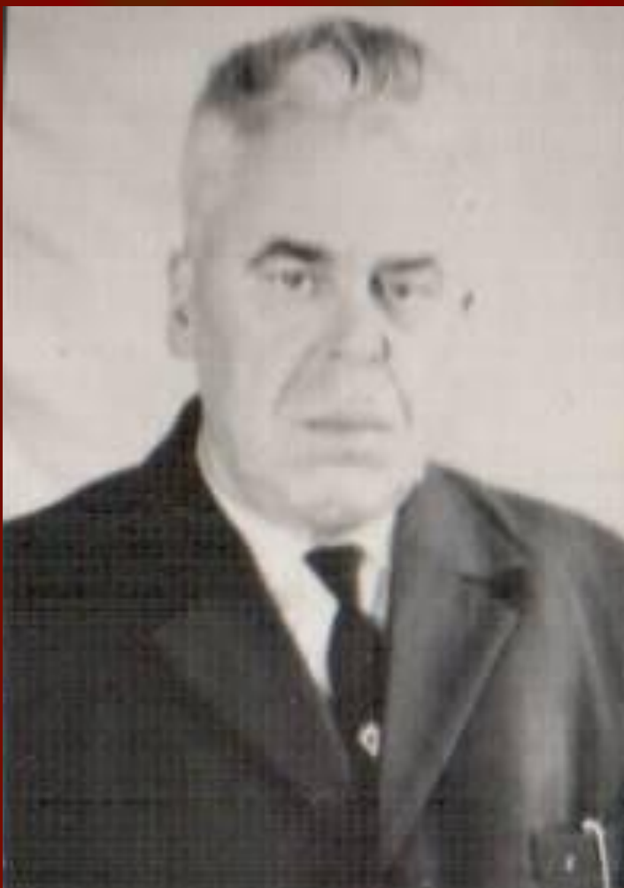
Пикуль Василий Ильич