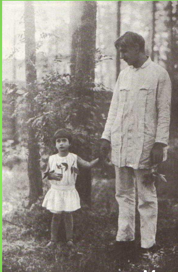
Корней Иванович с дочерью Мурой (Марией). 1924 г.