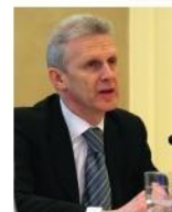
Андрей Фурсенко, Министр образования и науки РФ

Конференция была посвящена актуальным вопросам подготовки квалифицированных специалистов в области информационных технологий. Основным лейтмотивом стало обобщение результатов проекта по разработке профессиональных стандартов (квалификационных требований), реализованного АП КИТ при организационной поддержке Мининформсвязи России.