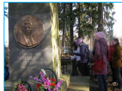
Памятник на могиле художника