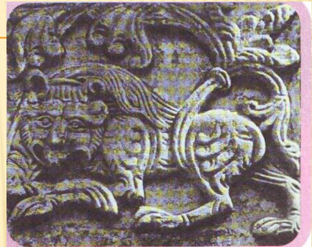
Резьба по белому камню