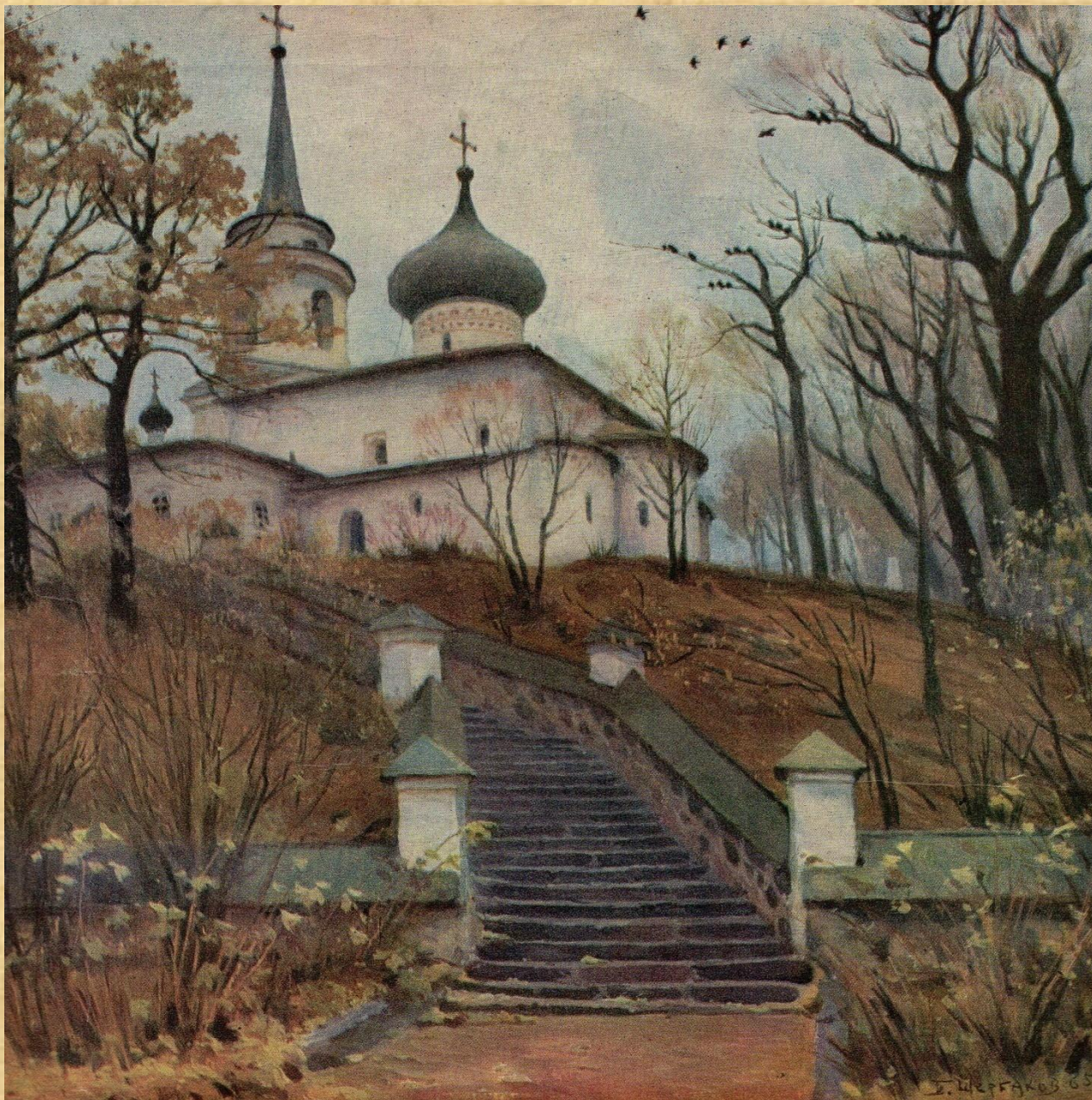
Б.Щербаков. Здесь Пушкин похоронен