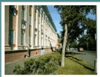
пр. Карла Маркса