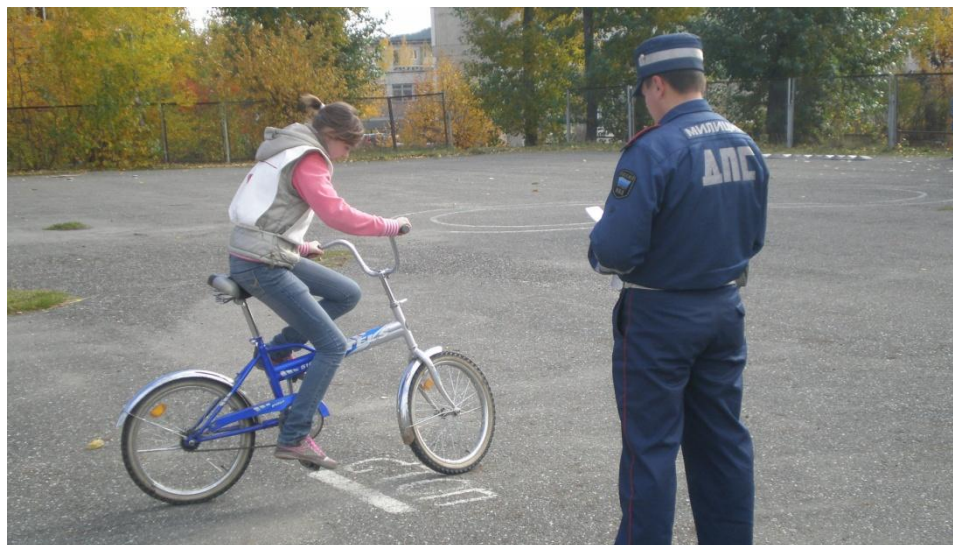
Школьный конкурс «Безопасное колесо»