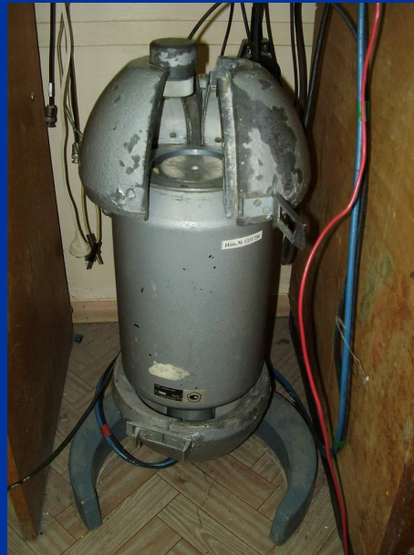
Рис. 4-Детектор гамма –спектрометра и его защита

Для уменьшения фона детектор был окружен свинцовой защитой толщиной 2,5 см.