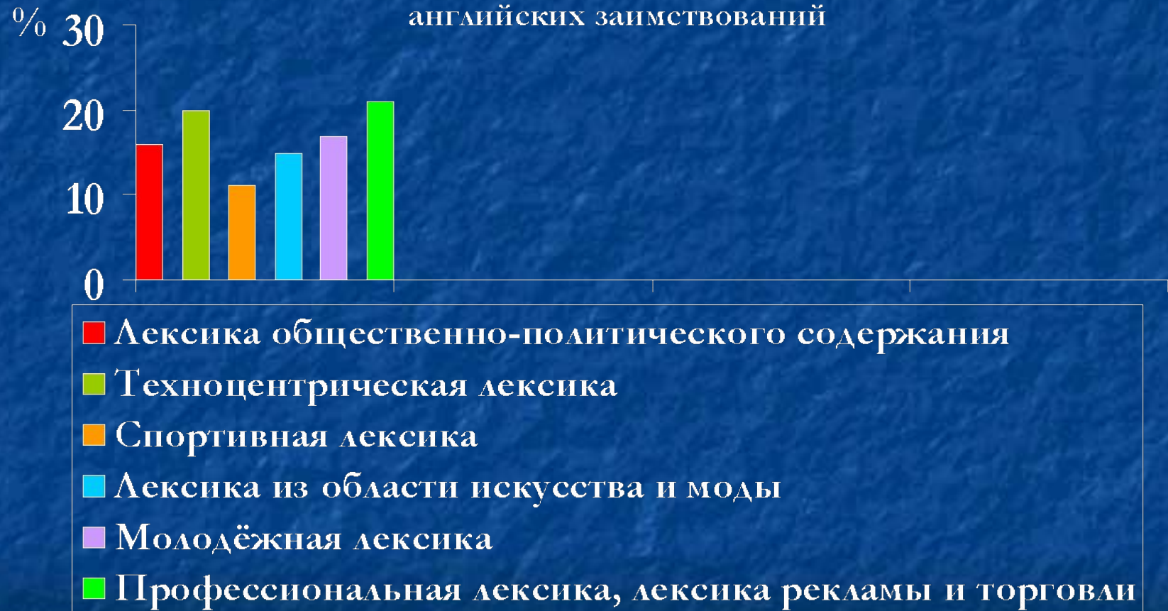
Приложение 4. Соотношение понятийно- тематических групп английских заимствований