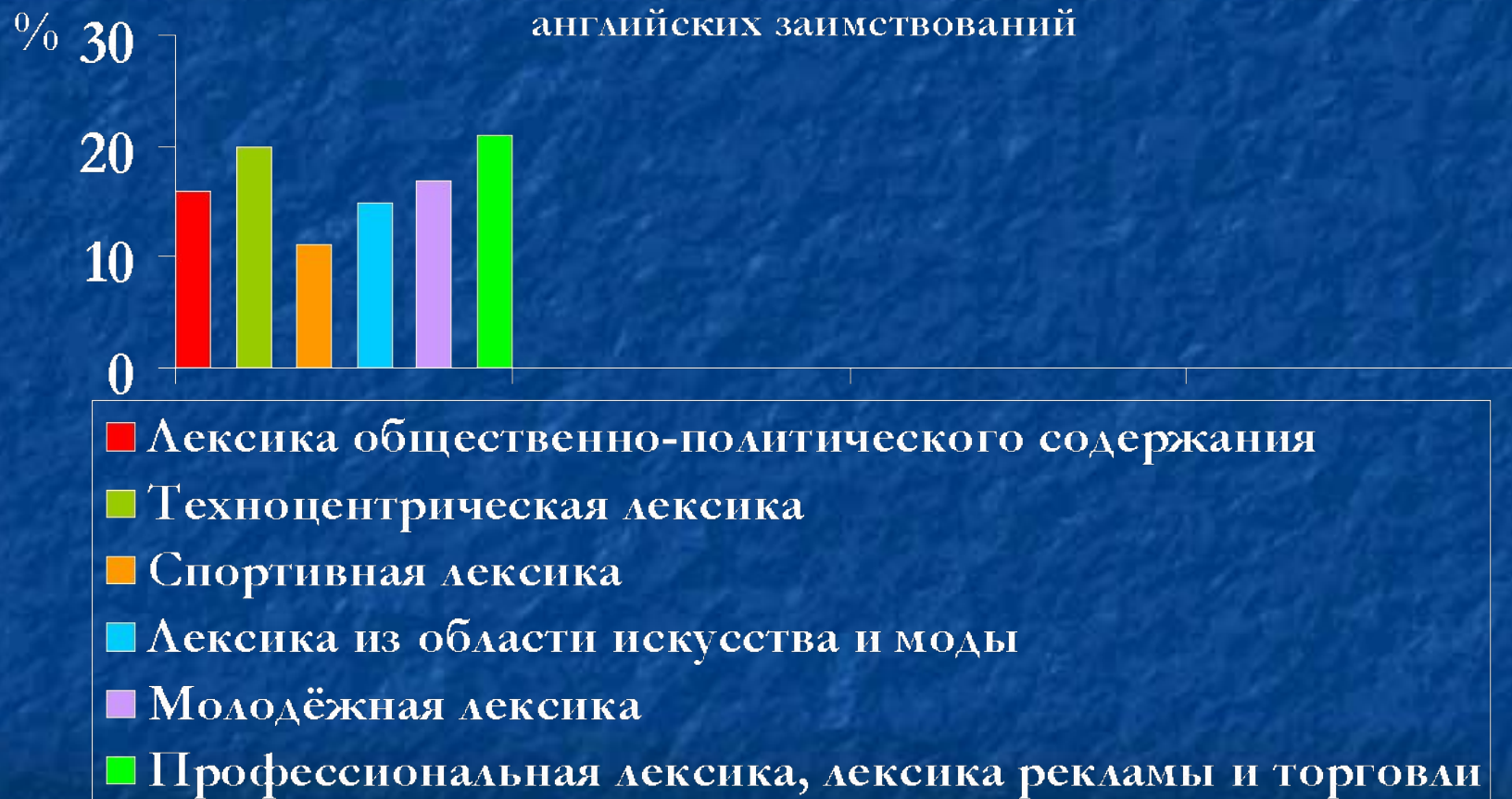
Приложение 4. Соотношение понятийно- тематических групп английских заимствований