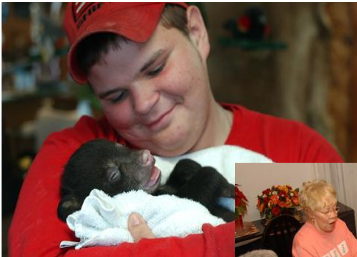
Элемент обучения: детеныш черного медведя