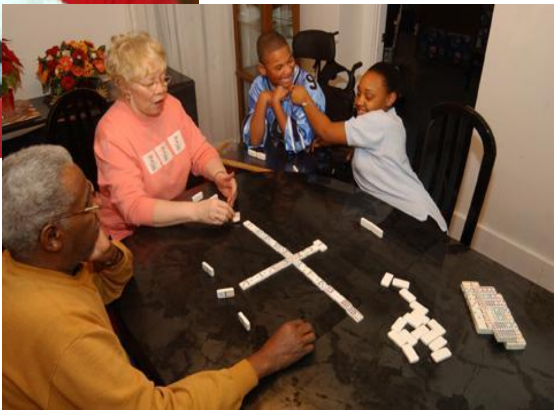
Воспитание в семье приемных родителей