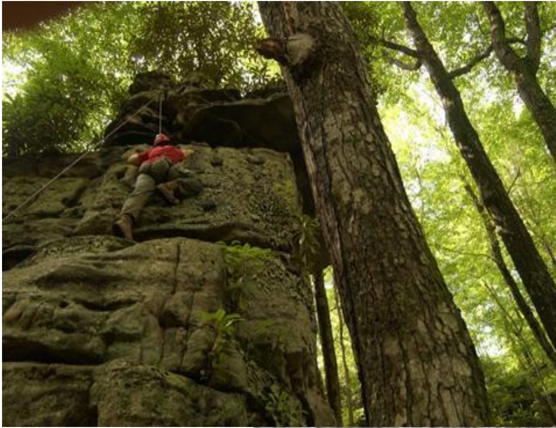
Огайонайл: Трудный маршрут