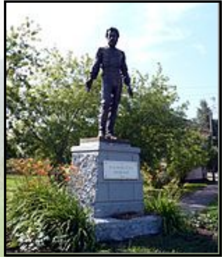
Памятник в г. Окуловка , Новгородская область