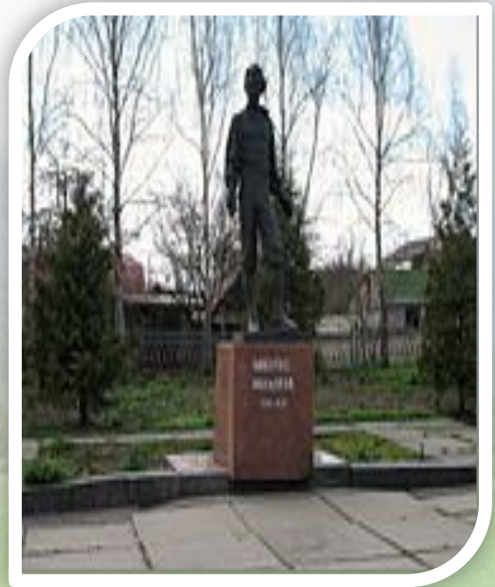
Памятник в г. Малин , Житомирская область Бюст в Севастополе

В 1884 году он женится на Маргарите Робертсон, дочери сэра Джона Робертсона — крупного землевладельца и политического деятеля Нового Южного Уэльса , который пять раз назначался её премьер-министром.