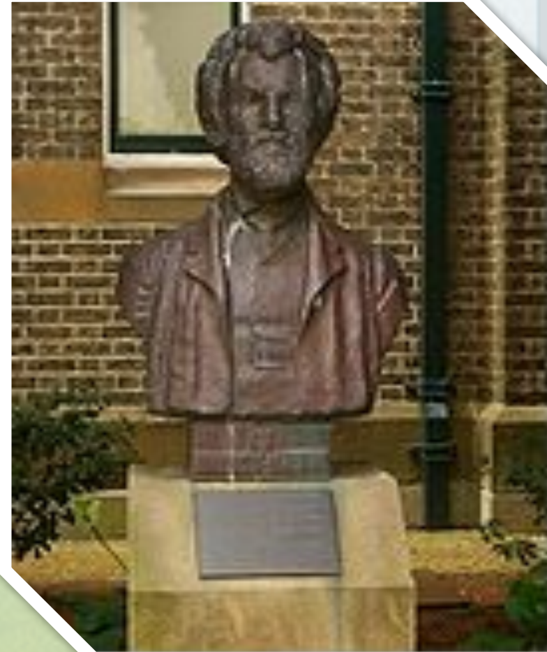
Бюст Миклухо-Маклая у Музея им. У. Маклея в Сиднее

В 1876—1877 годах ученый снова проводит несколько месяцев на северо-восточном берегу Новой Гвинеи, вернувшись к тому племени, жизнь которого он наблюдал ранее. К сожалению, пребывание его на острове было недолгим, и признаки анемии и общего истощения вынудили его покинуть остров и отбыть в Сингапур . Лечение заняло более полугода. Недостаток финансовых средств не позволил Миклухо-Маклаю вернуться в Россию, и он был вынужден перебраться в Сидней ( Австралия ), где поселился у русского консула. Затем Миклухо-Маклай некоторое время живёт в Английском клубе , а потом перебирается в дом общественного деятеля, учёного-зоолога и председателя Линнеевского общества Нового Южного Уэльса У. Маклея . Маклей помогает Миклухо-Маклаю реализовать высказанную им на Линнеевском обществе идею строительства Австралийской зоологической станции .