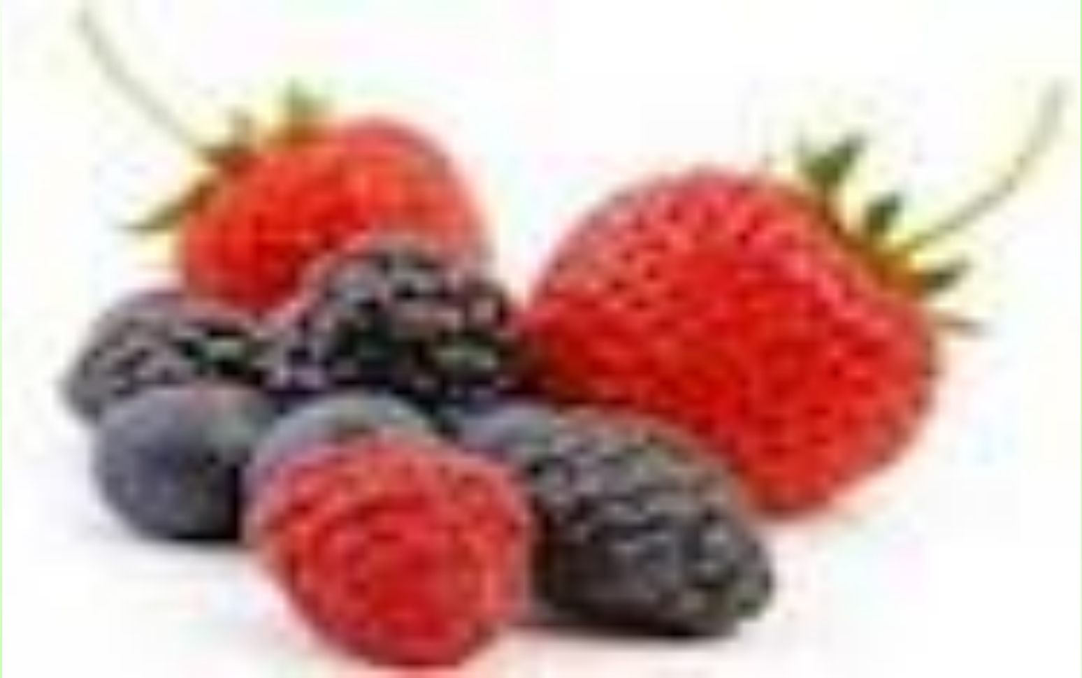
Земляника, малина, ежевика