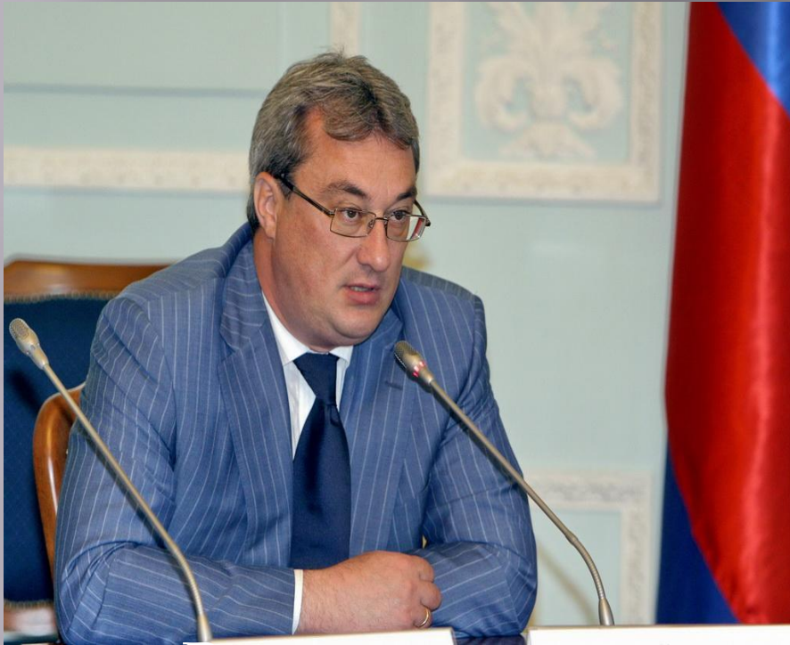
Гайзер Вячеслав - глава Республики Коми