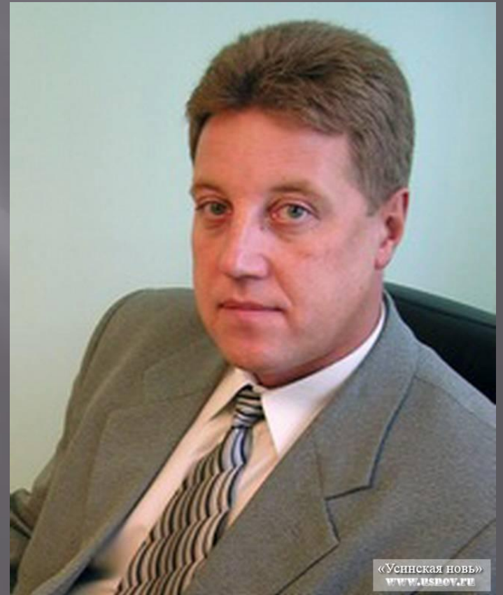
Поздеев Иван мэр города Сыктывкара