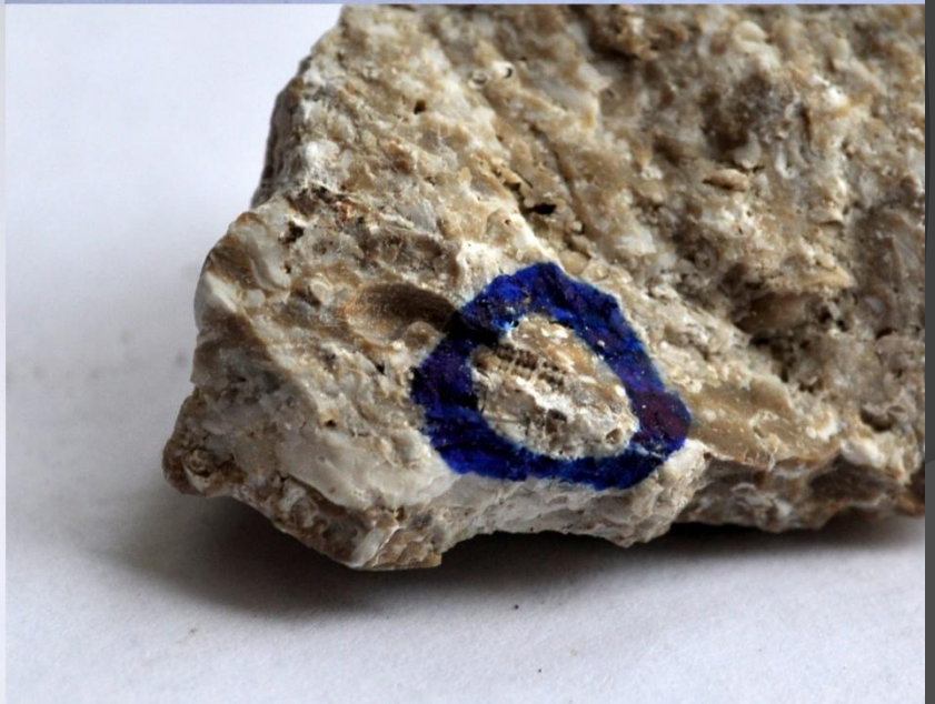
Несколько образцов, доказывающих, что ранее здесь было море.