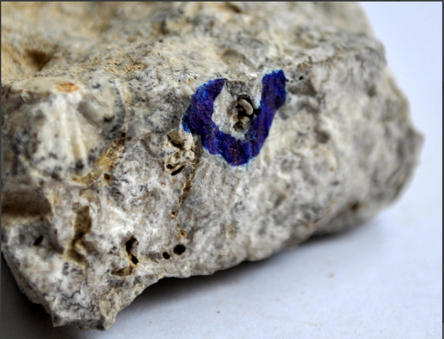
Образец с вкраплением морской фауны