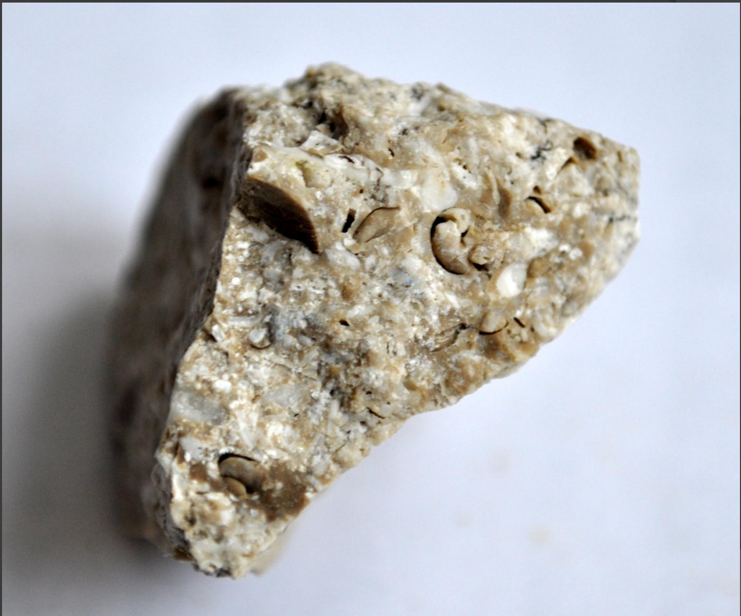
Образец с обильным вкраплением фауны