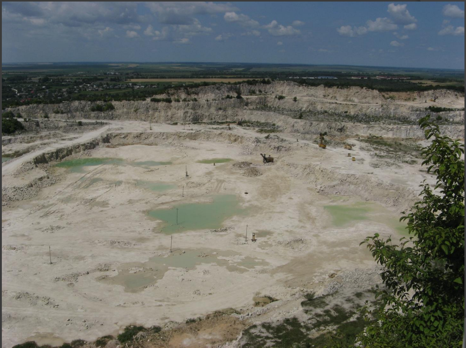
г. Кармалюковская - Большой карьер – место добычи известняка