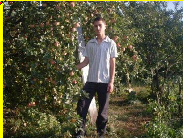
Призер фоторабот «Краса земная»