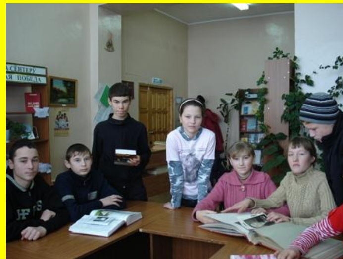
На выставке «Великая Победа»