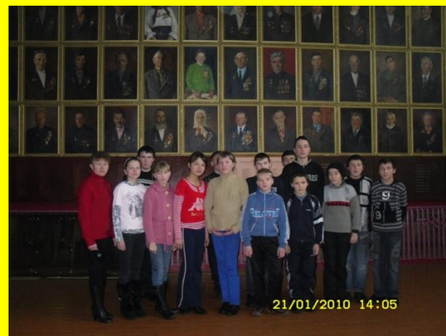
В портретной галерее Боевой Славы