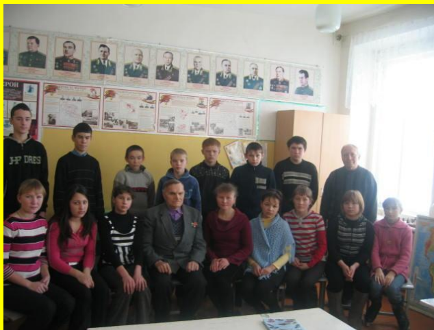
Встреча с ветеранами