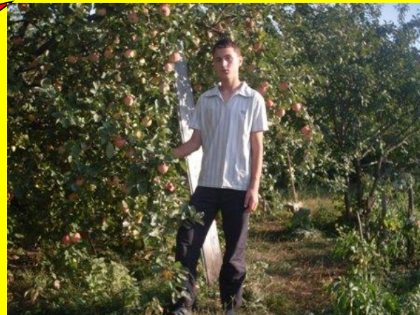
Призер фоторабот «Краса земная»