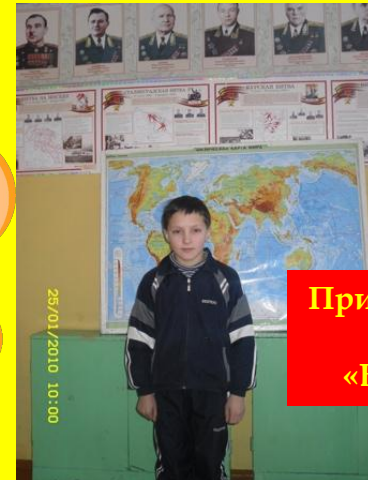
Призер районного конкурса «Белая ладья»