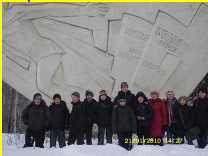
Мы чтим павших