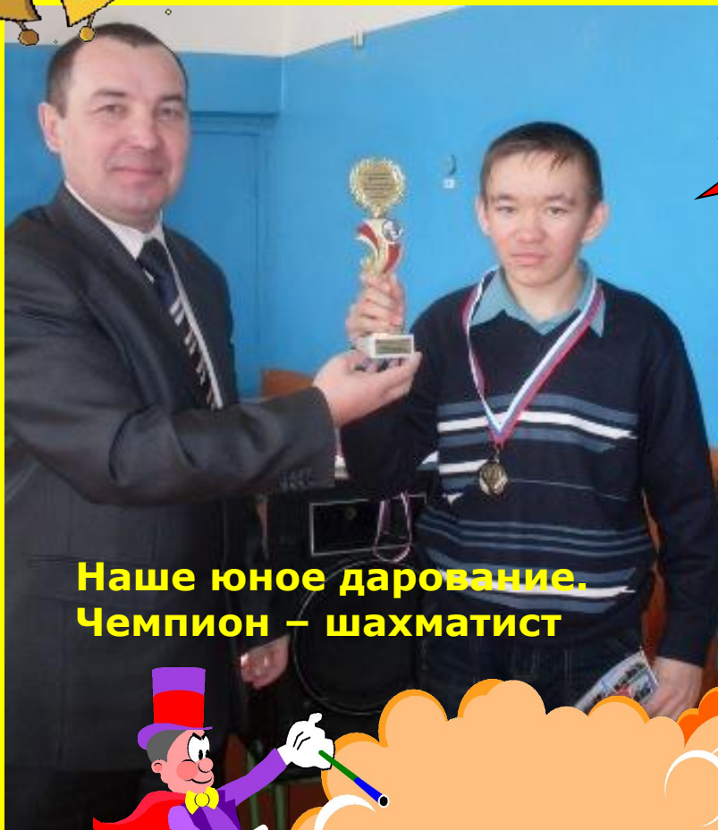
Наше юное дарование. Чемпион – шахматист