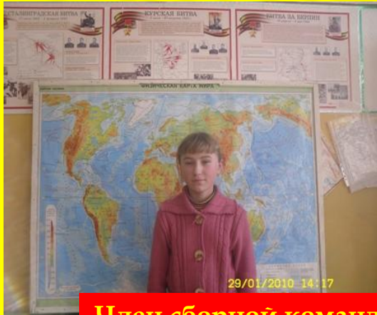
Член сборной команды по волейболу