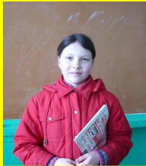
Внештатный корреспондент газеты «Танташ»