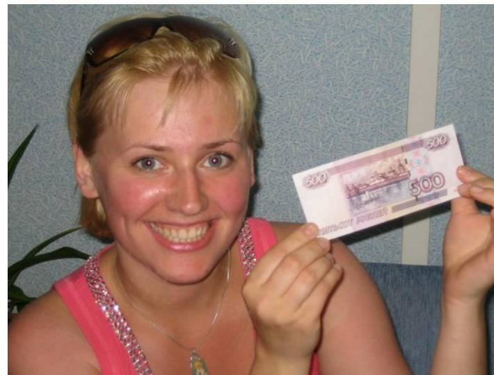
Победительница игры «Легкие деньги»

Слушает радио в автомобиле, по дороге на работу и на отдыхе.