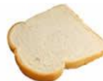
Кулинарно обработанные продукты