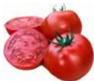
Свежие, цельные и натуральные, естественной окраски

Продукты высокого качества – это свежие и натуральные продукты, имеющие естественную окраску. Они не подвергаются кулинарной обработке.