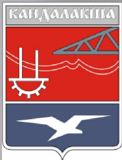
СТАРЫЙ ГЕРБ ГОРОДА КАНДАЛАКША