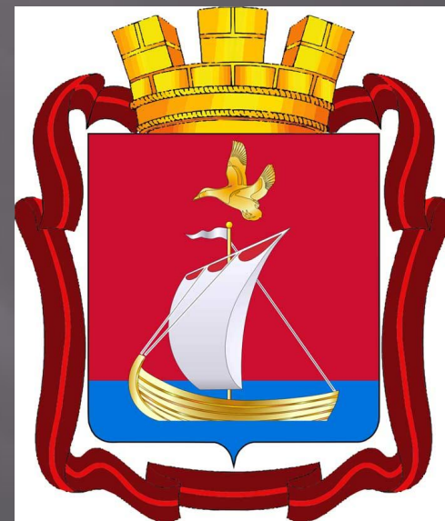
ДЕЙСТВУЮЩИЙ ГЕРБ ГОРОДА КАНДАЛАКША