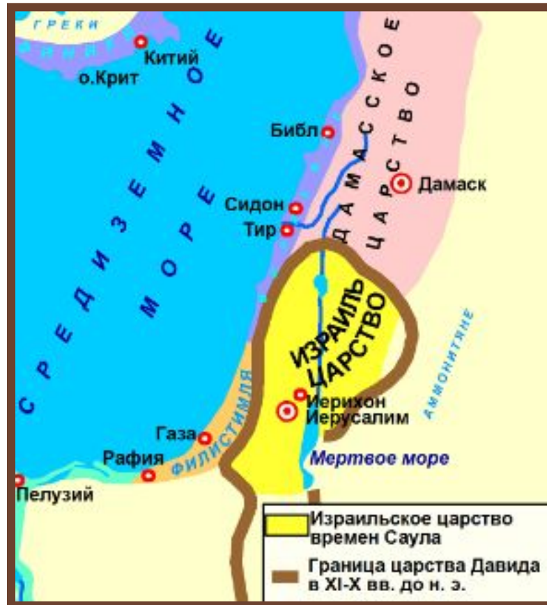
Израиль в древности