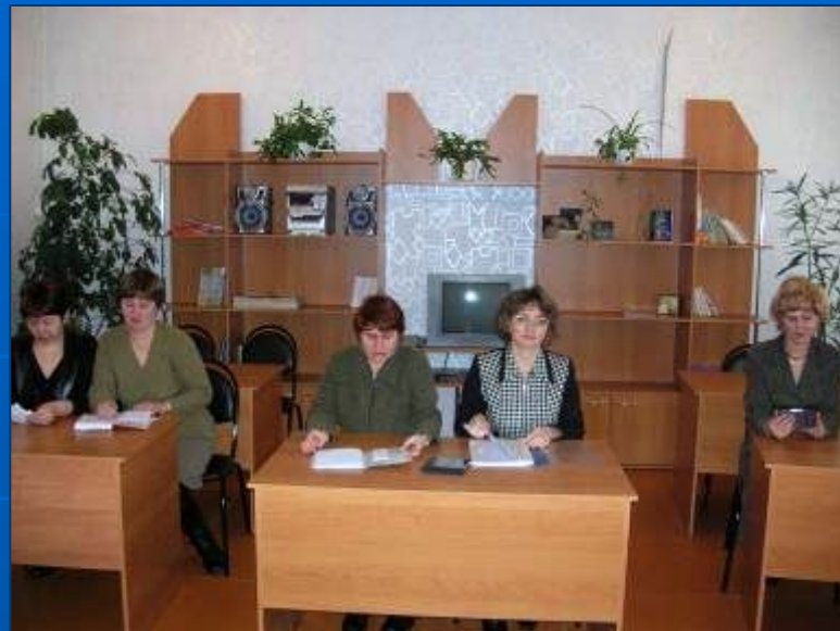
Кабинет информационных технологий