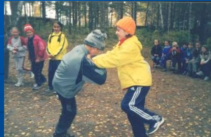
Ни осень, ни зима нам нипочем – Всё равно мы в лагере своем!