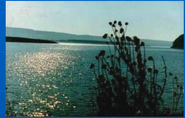
Байкал. Пик Черского