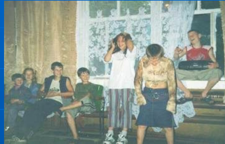
День наоборот «И как девчонки ходят в этих юбках?!»