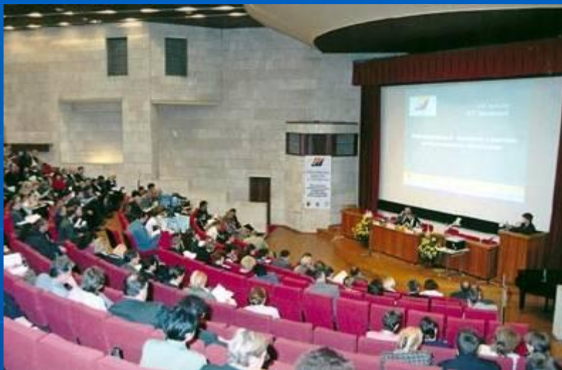
Всероссийская Интернет-конференция в Санкт-Петербурге