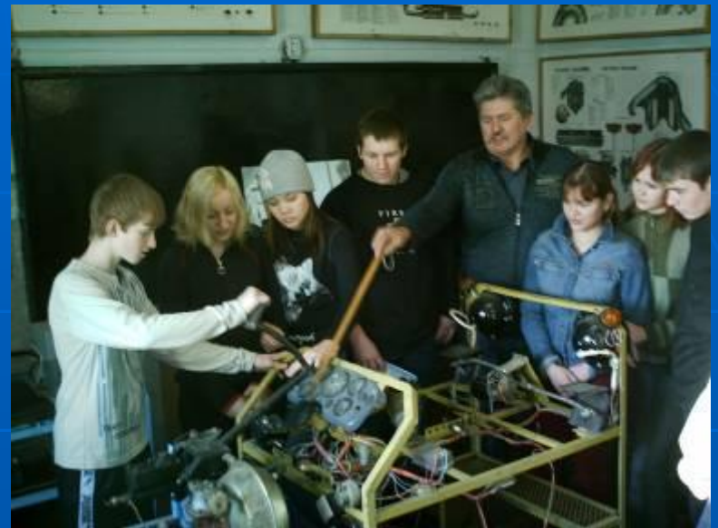
Лаборатория по автоделу