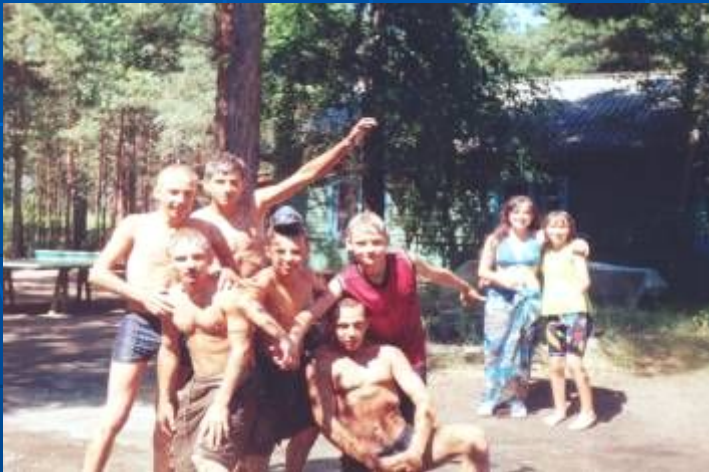
«Веселые» результаты «Дня Нептуна»