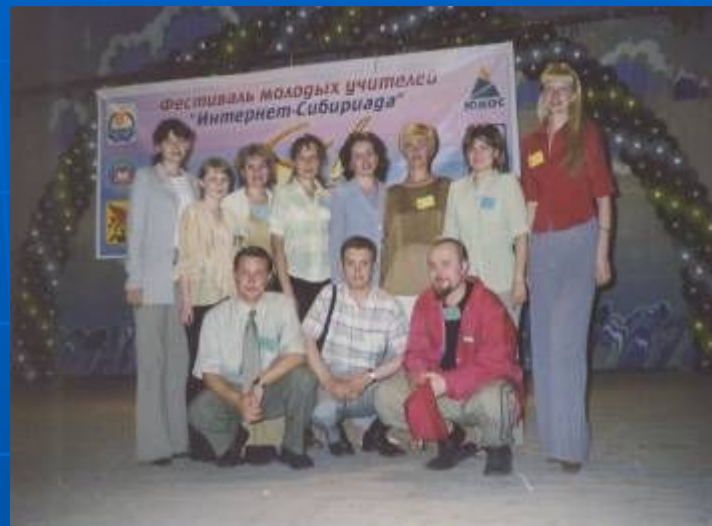
Фестиваль молодых учителей «Интернет-Сибиряда»