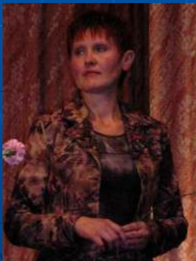
Участники региональной научно-практического симпозиума в рамках программы «Шаг в будущее»