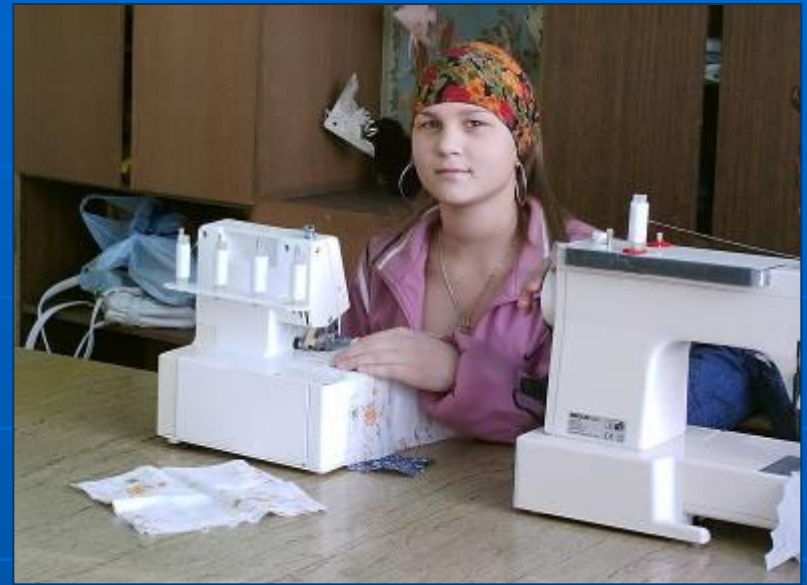
Кабинет обслуживающего труда