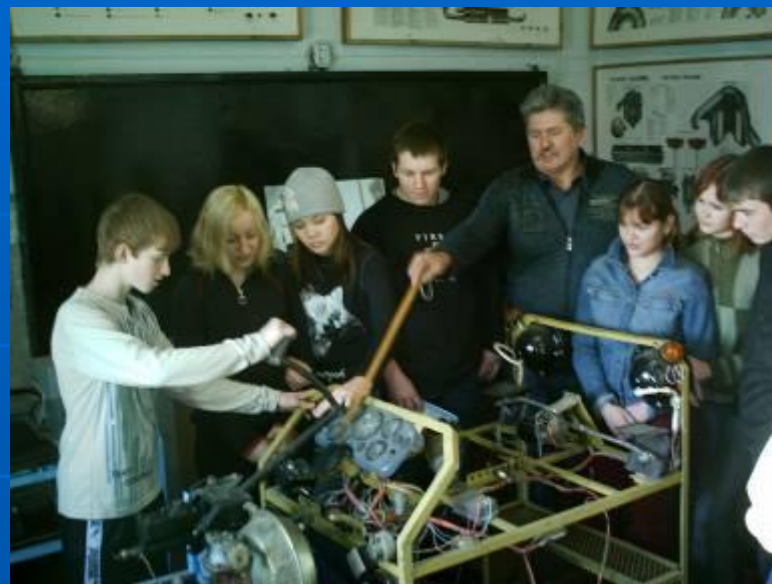
Лаборатория по автоделу