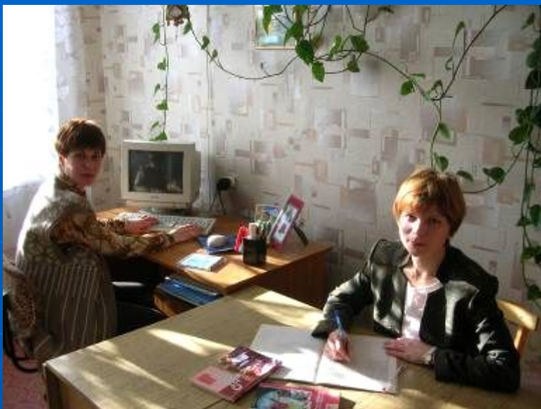
Кабинет психологической службы