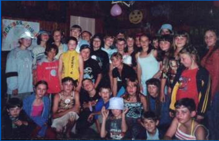
Дружная семейка из «Ласковой долины» II сезон 2005 года