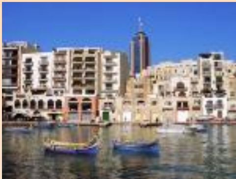
Основная туристическая зона Мальты