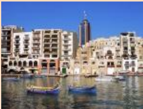
Основная туристическая зона Мальты