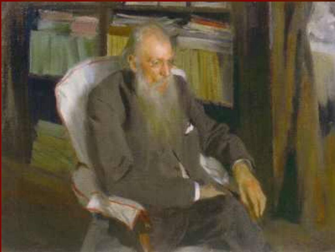
Б.М.Кустодиев «Портрет писателя Д.Л.Мордовцева»