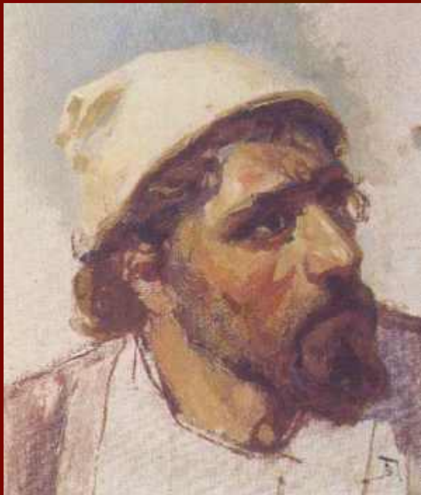
В.Д.Поленов «Голова итальянца» («Голова Христа»)