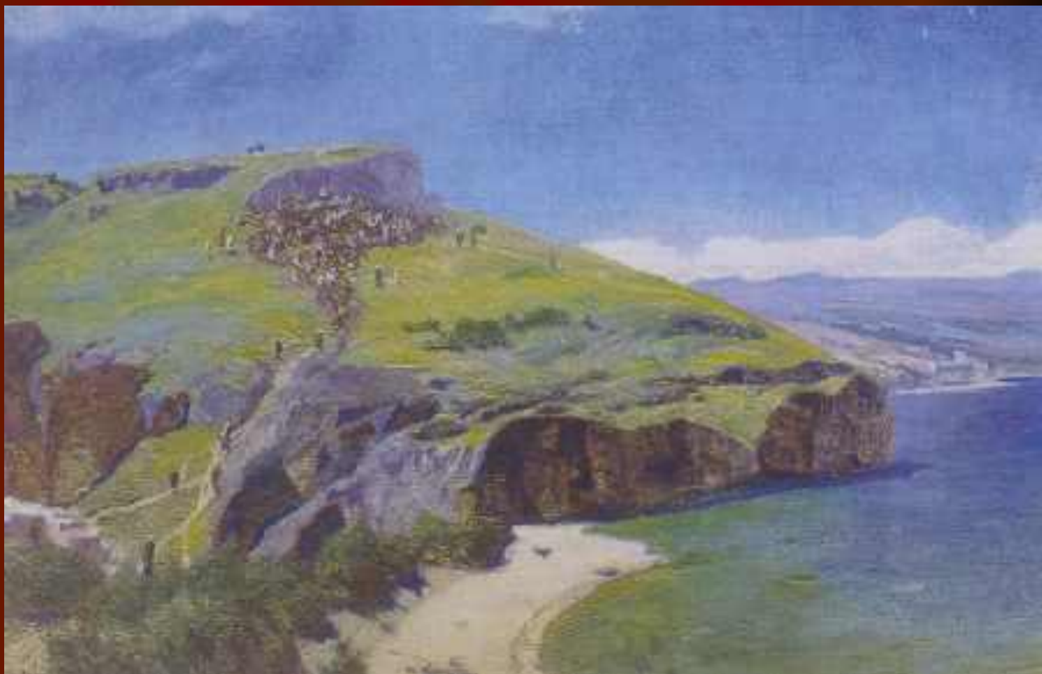
В.Д.Поленов «Палестинский пейзаж»