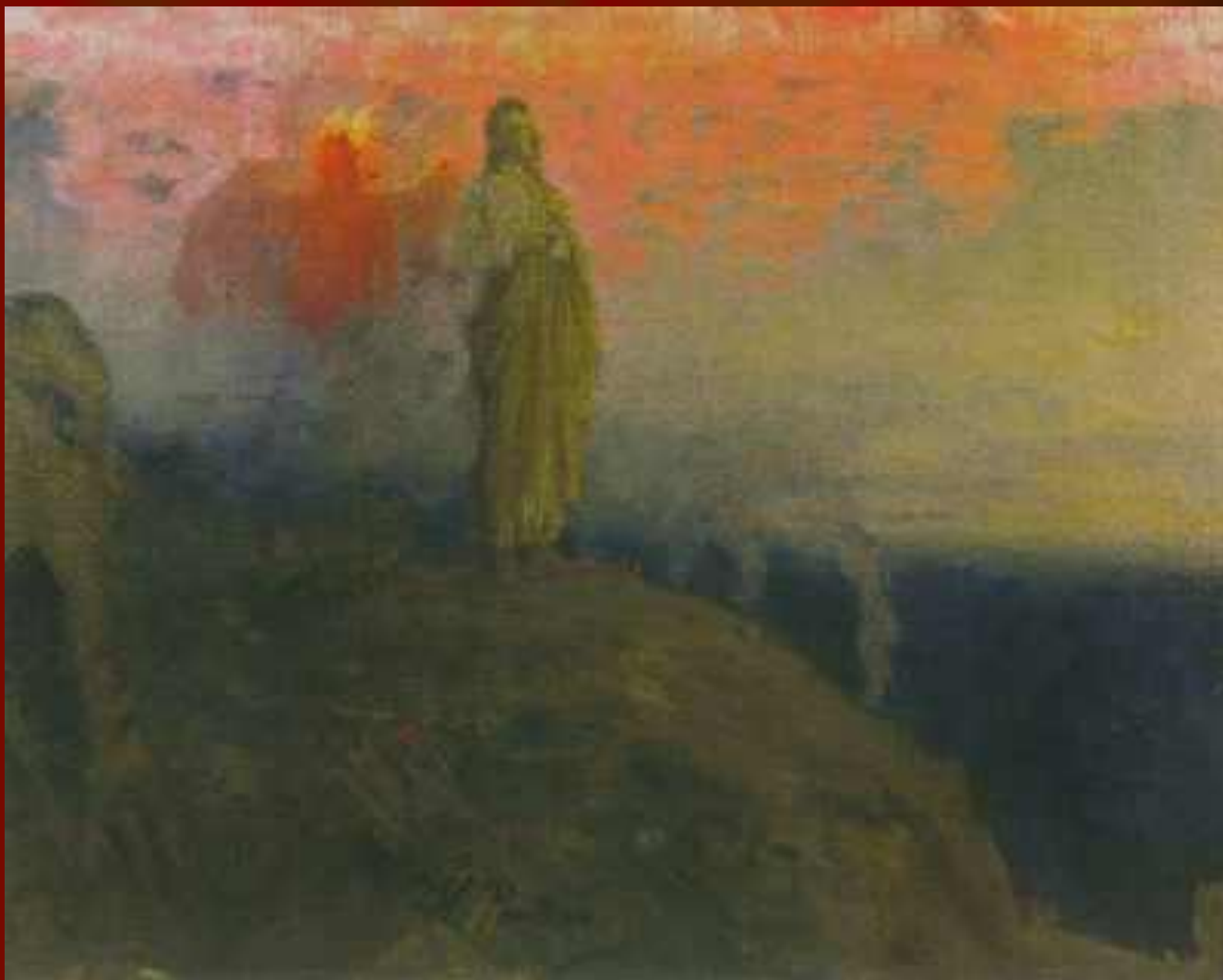
И.Е.Репин «Искушение Христа»