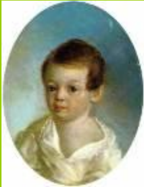
Александр Сергеевич Пушкин ( 1799 – 1837г.)