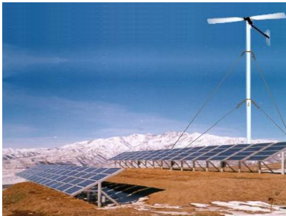
Гибридный солнечно-ветровой источник электроэнергии