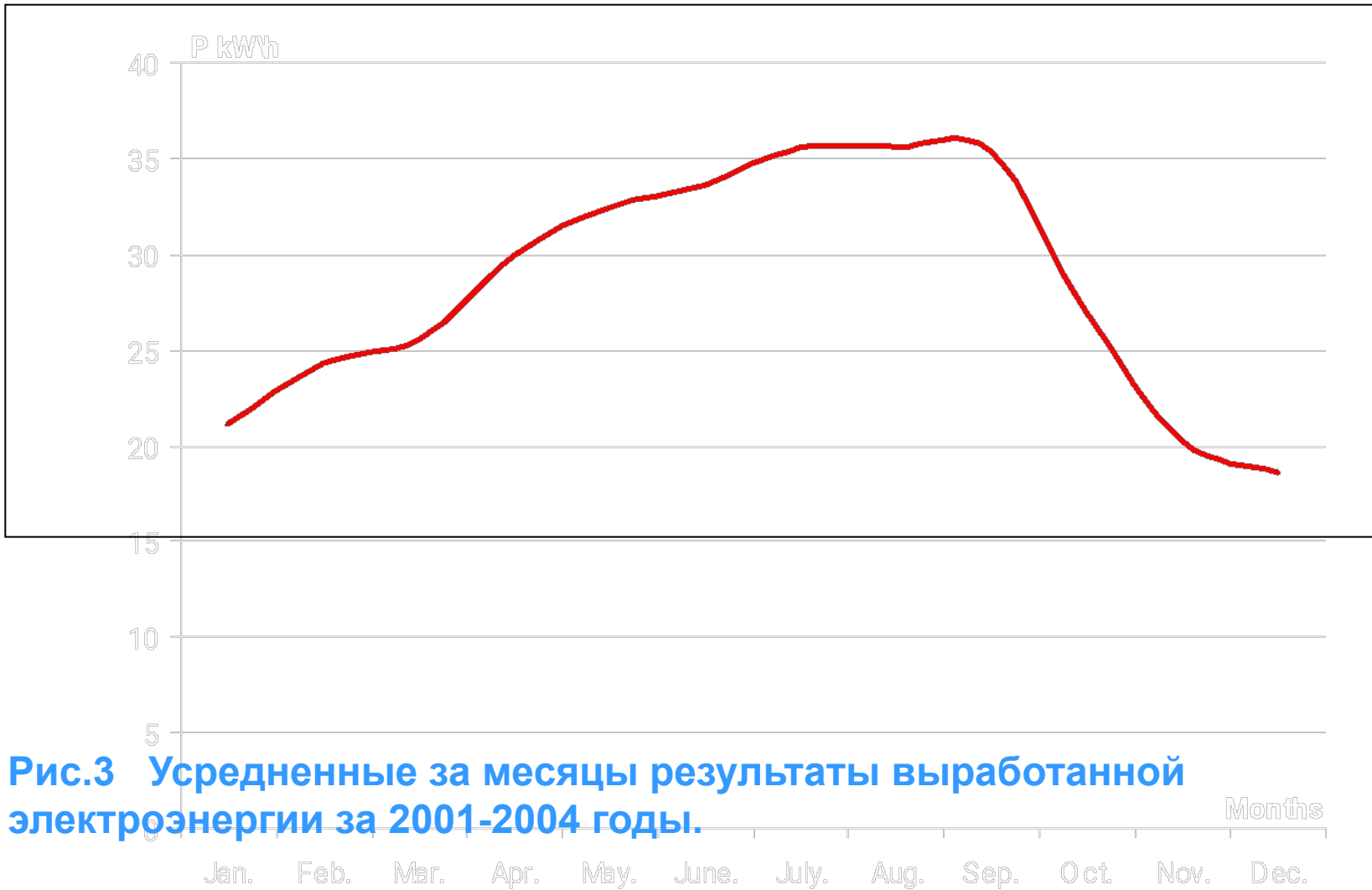
Рис.3 Усредненные за месяцы результаты выработанной электроэнергии за 2001-2004 годы.