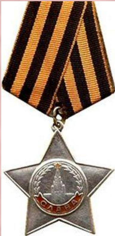
Орден Славы III степени