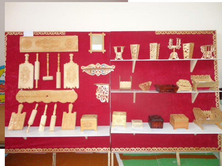
Сувениры своими руками