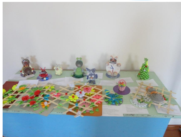
Сувениры к Дню пожилого человека своими руками