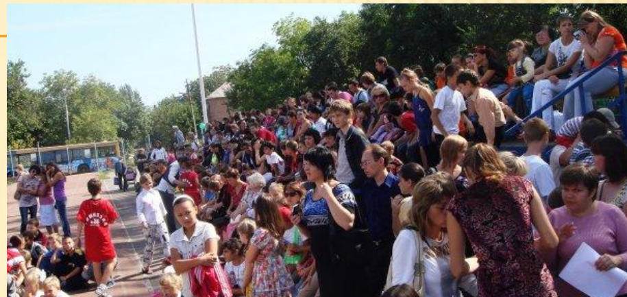
Районный праздник «Должны смеяться дети»