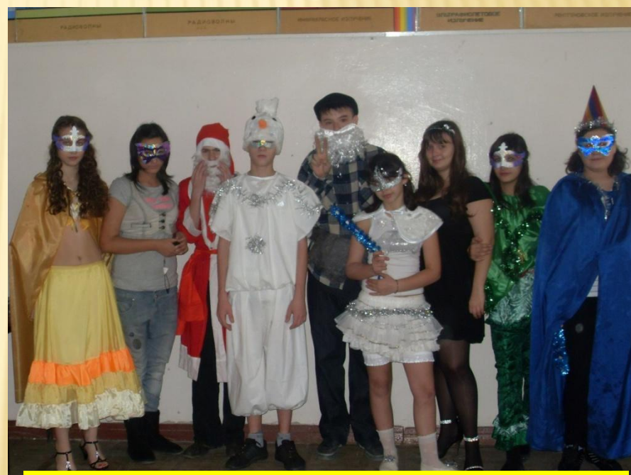
Акция «Рождественский перезвон»