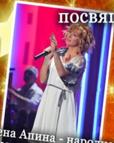
Алена Апина - народная артистка России, дважды обладательница "Золотого граммофона"