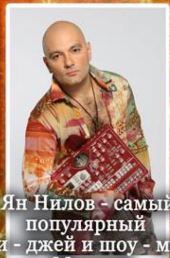
Ян Нилов - самый популярный ди-джей и шоу-мен Москвы