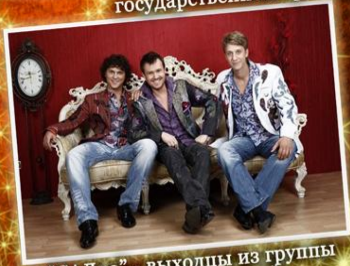
"САДКО" - выходцы из группы "Золотое кольцо"

Концерт будет проводиться 26 октября 2011 года в одном из лучших залов города Москвы