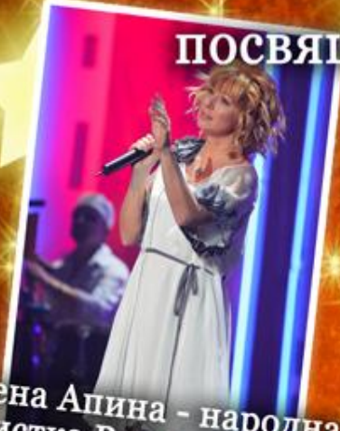
Алена Апина - народная артистка России, дважды обладательница "Золотого граммофона"