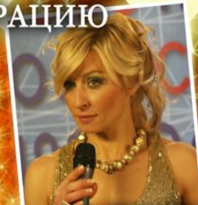
Татьяна Овсиенко - заслуженная артистка России, лауреат государственной премии

КОРПОРАЦИЯ Корпоративная сеть Личные Флеш-офисы