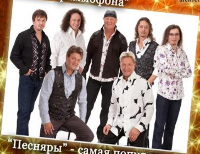
"Песняры" - самая популярная группа 70-80 годов

КОРПОРАЦИЯ Корпоративная сеть Личные Флеш-офисы