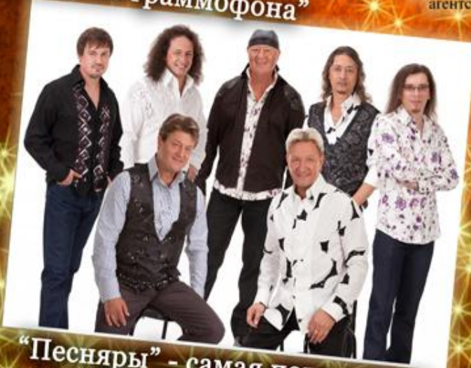
"Песняры" - самая популярная группа 70-80 годов