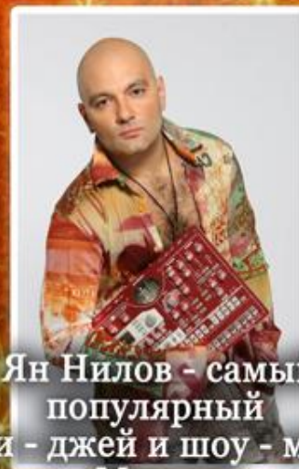
Ян Нилов - самый популярный ди-джей и шоу-мен Москвы