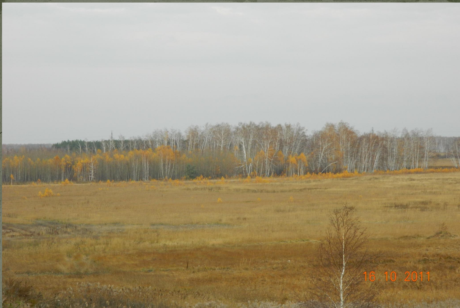
Фото 6. Сырчи́ков коло́к