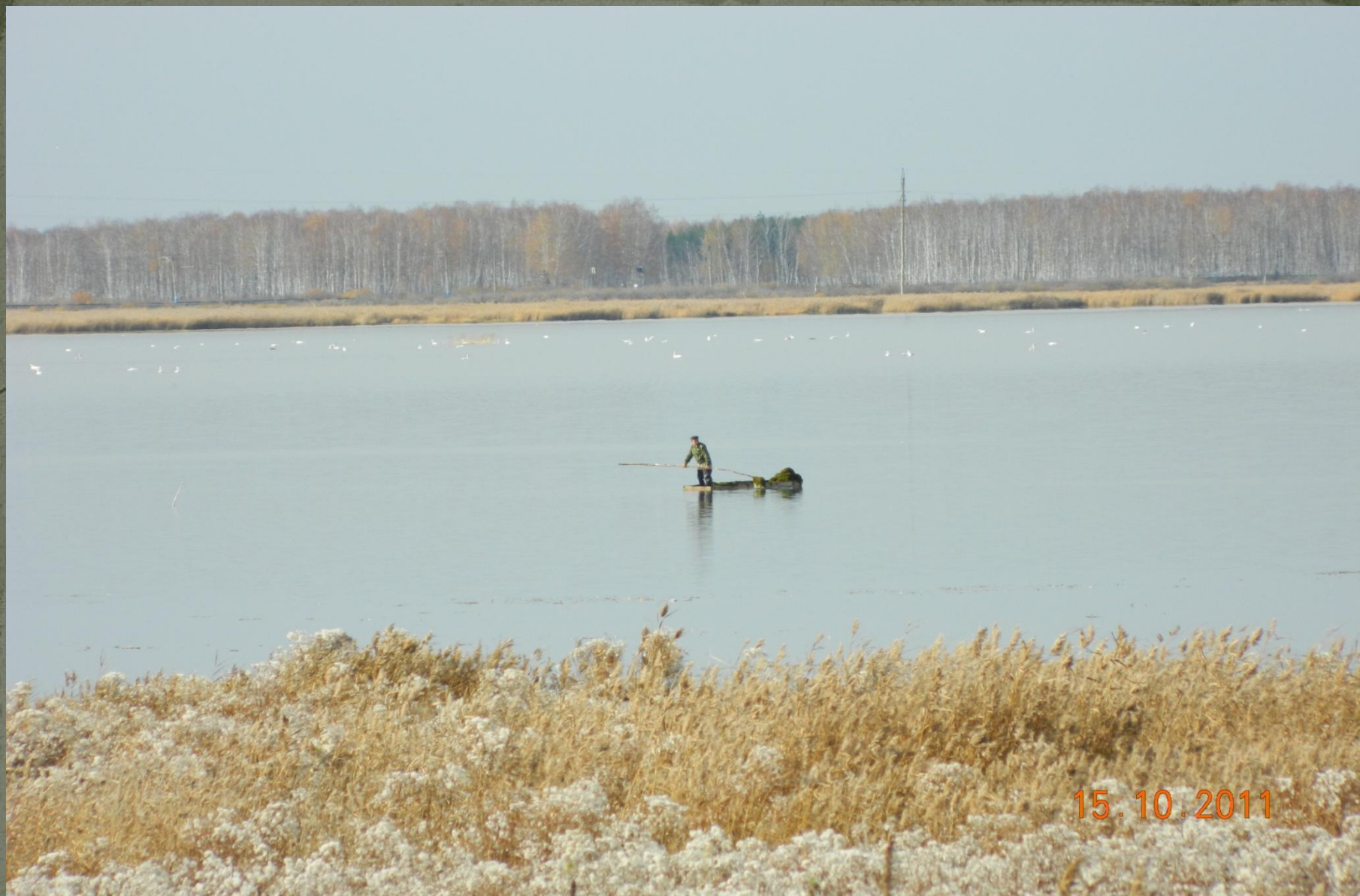
Фото 4. Оз.Малое Байдарское