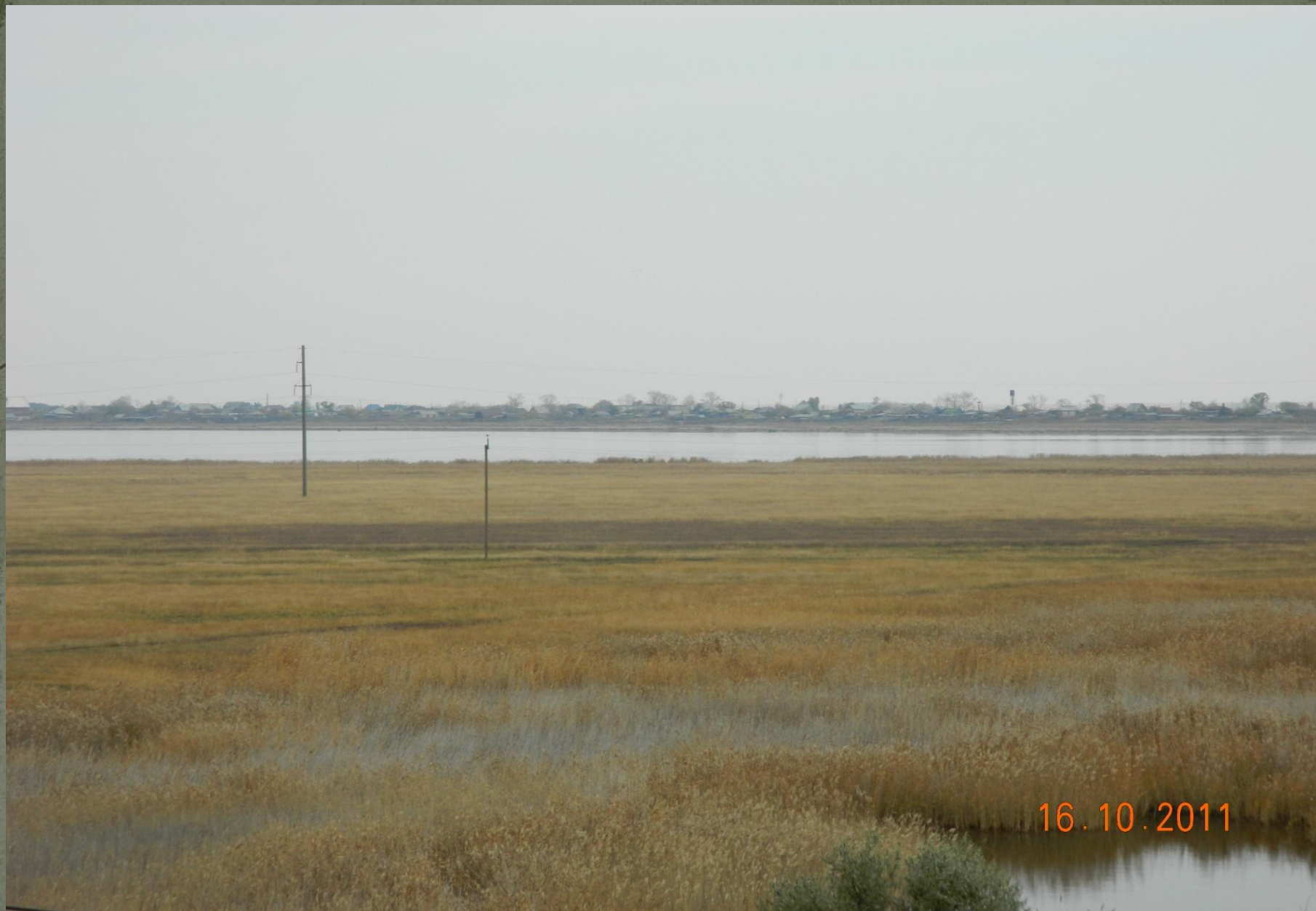
Фото 1. С.Байдары