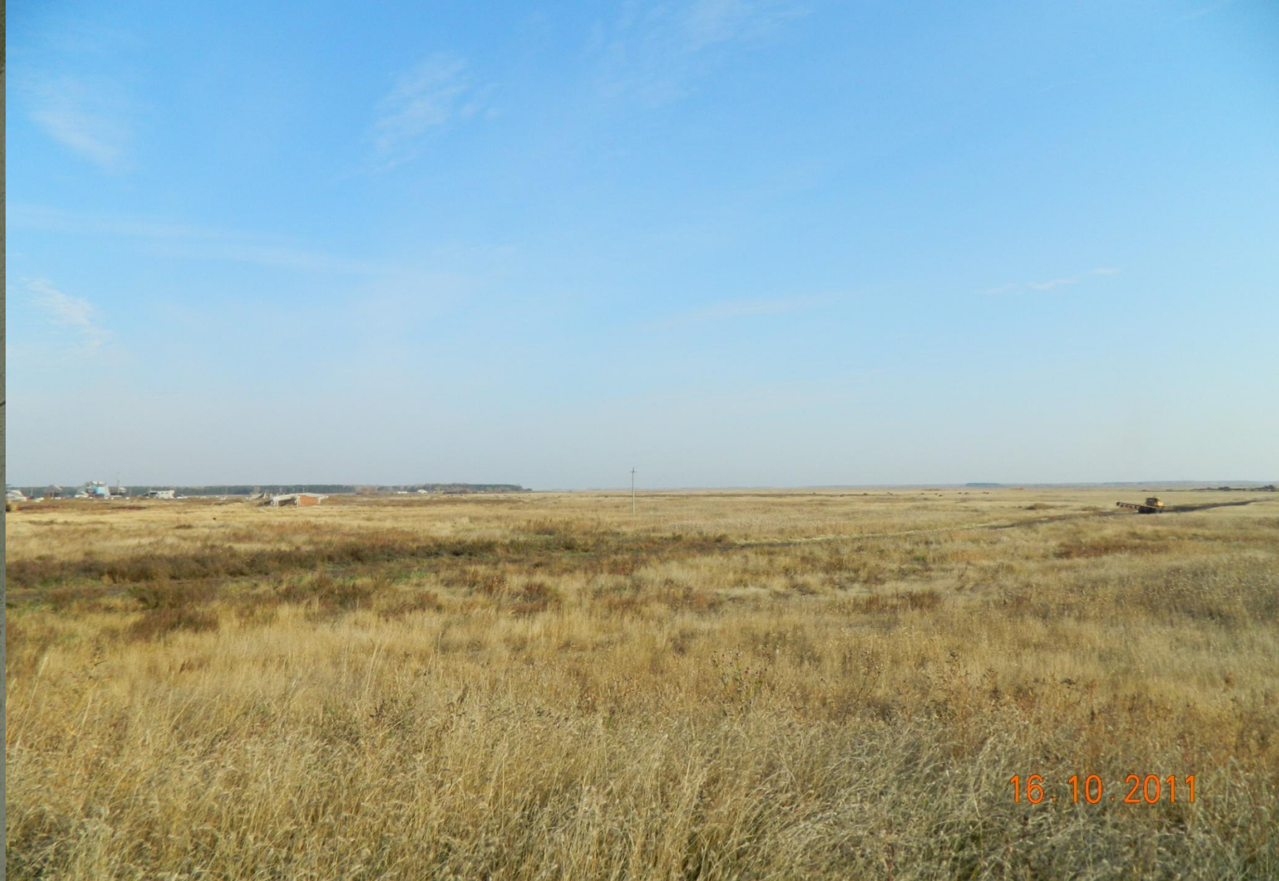
Фото 5. Оз.Буланово