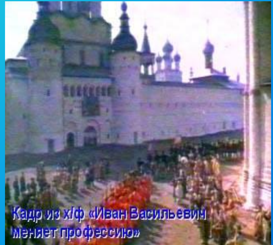
Кадр из х/ф «Иван Васильевич меняет профессию»