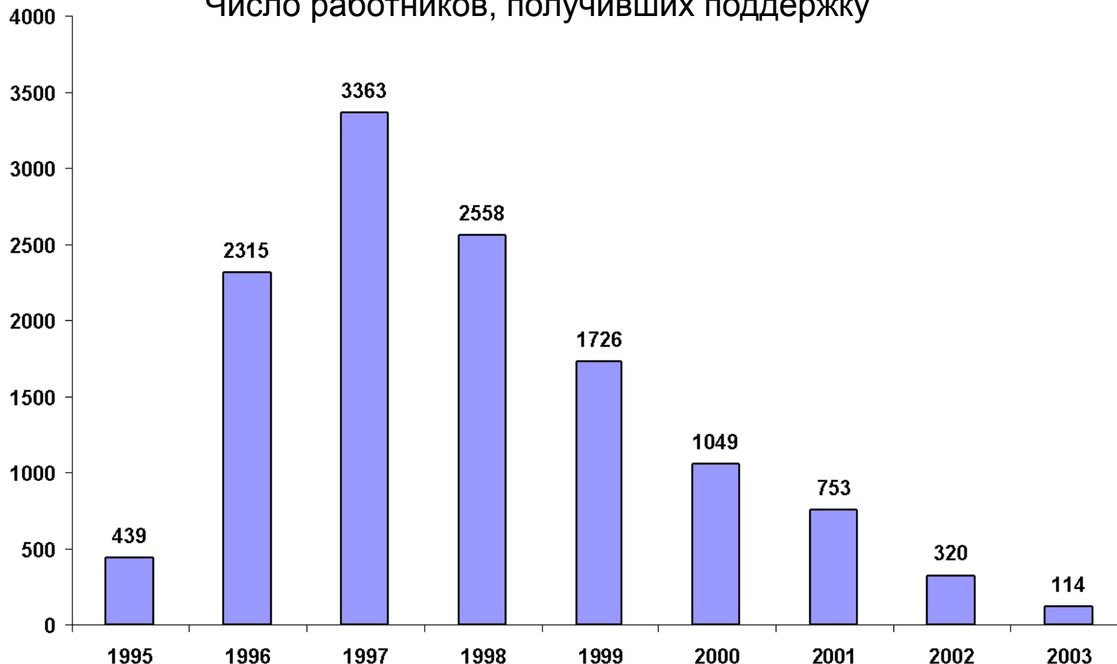
Число работников, получивших поддержку