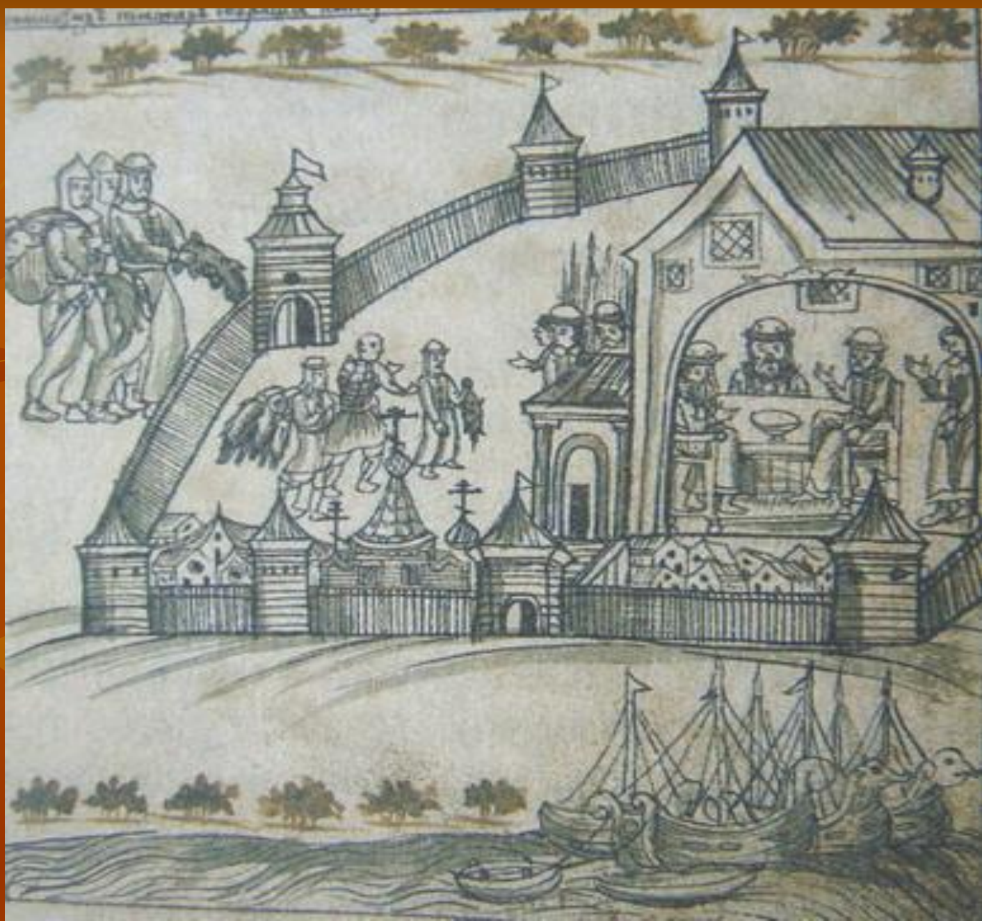
Сбор ясака. Миниатюра из летописи начала XVIII в.