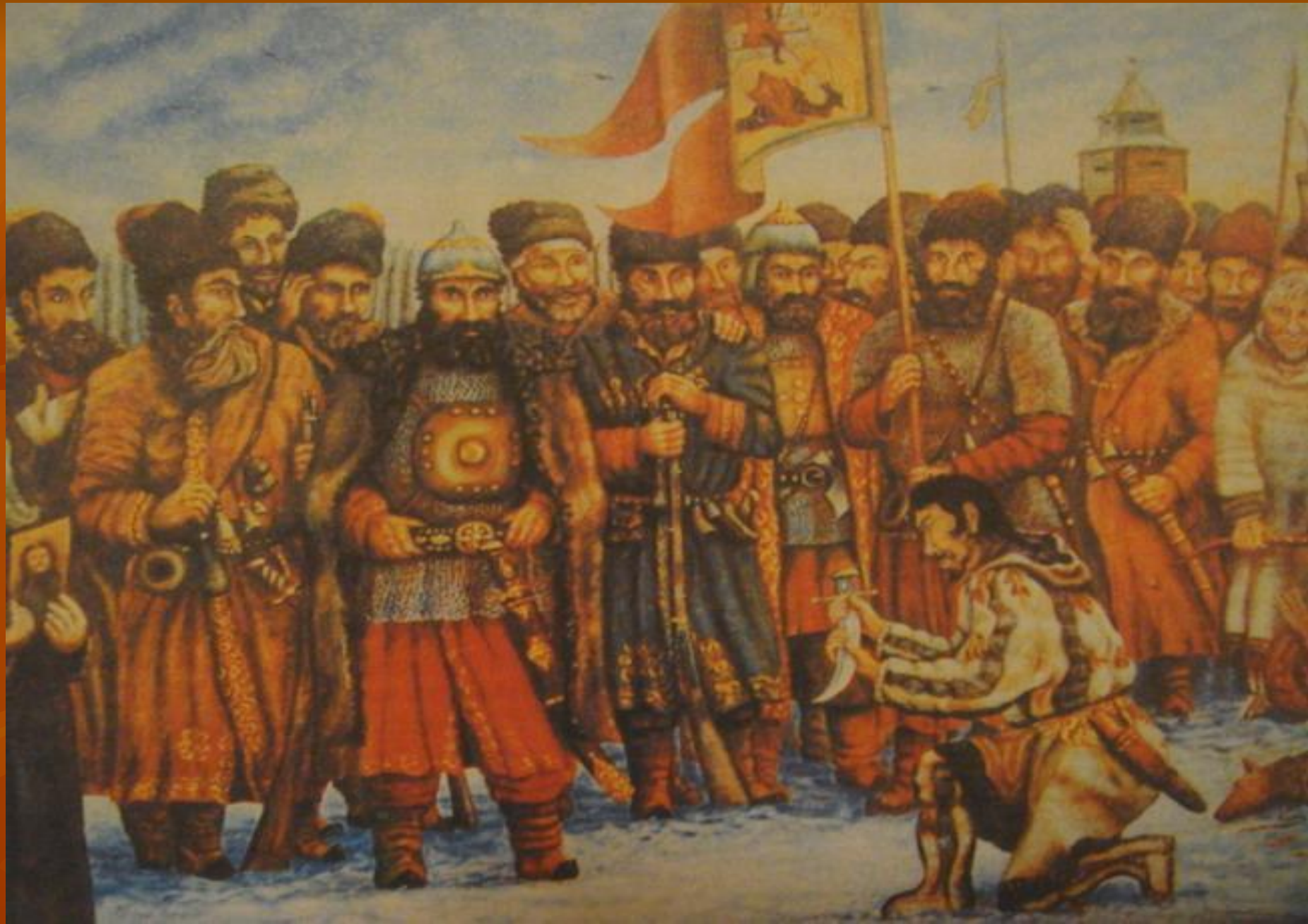
«Клятва». Картина П.Бахлыкова.