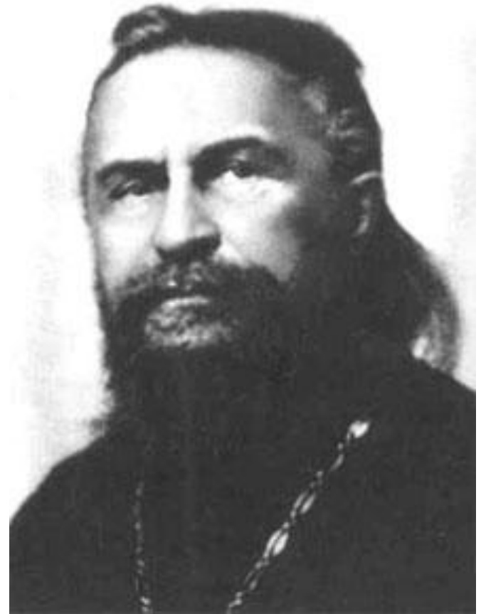
С. Н. Булгаков