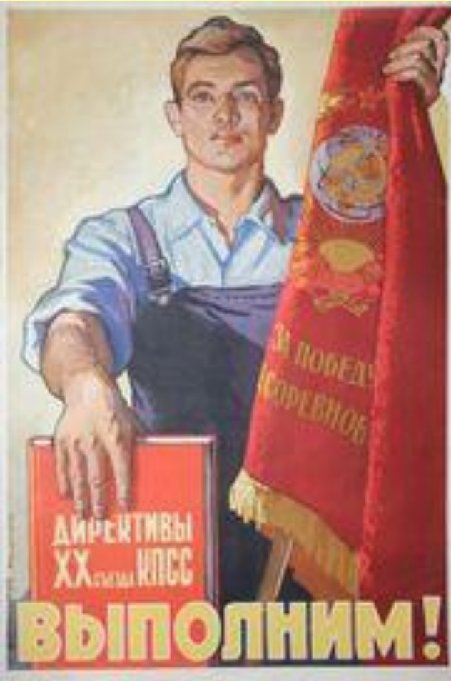
Плакат 1956 г.

С отчетным докладом ЦК выступал Н.С. Хрущев.