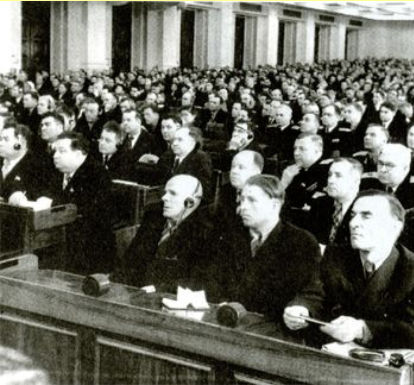
Зал заседаний XX съезда

Доклад «О культе личности и его последствиях» был прочитан в последний день съезда на закрытом заседании.