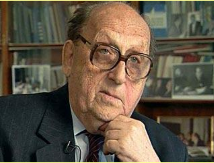
Георгий Аркадьевич Арбатов.