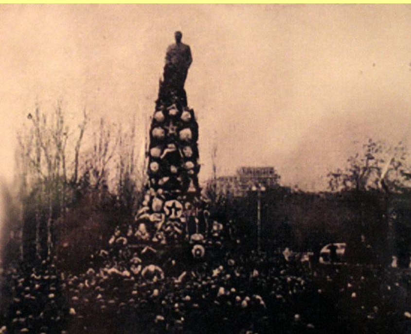
Митинг у памятника Сталину в Тбилиси. Март 1956 г.