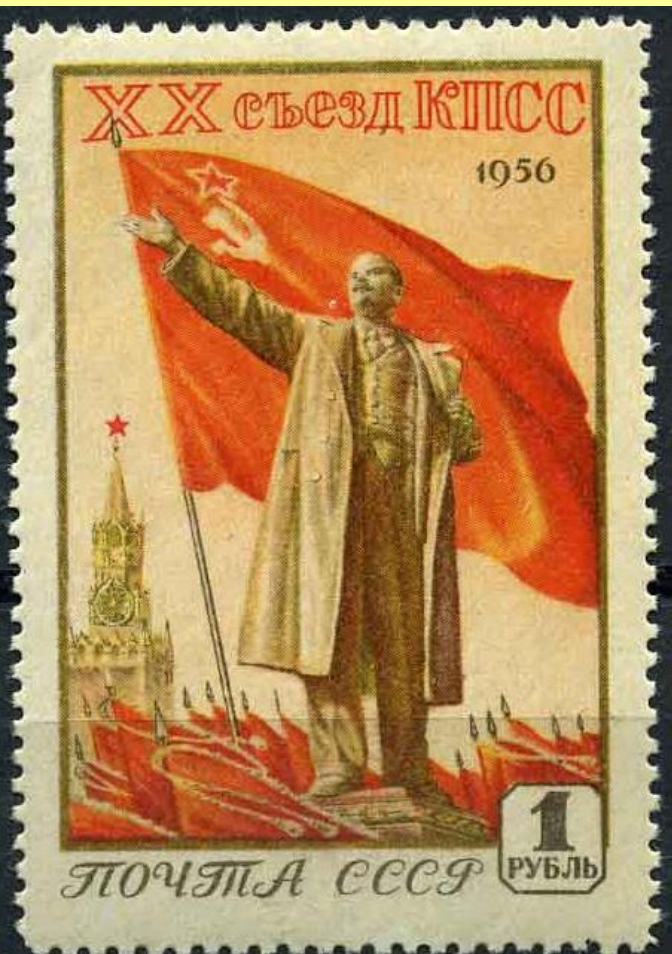
Марка в ознаменовании XX съезда КПСС. 1956 г.

14 февраля 1956 г. – открытие XX съезда КПСС.