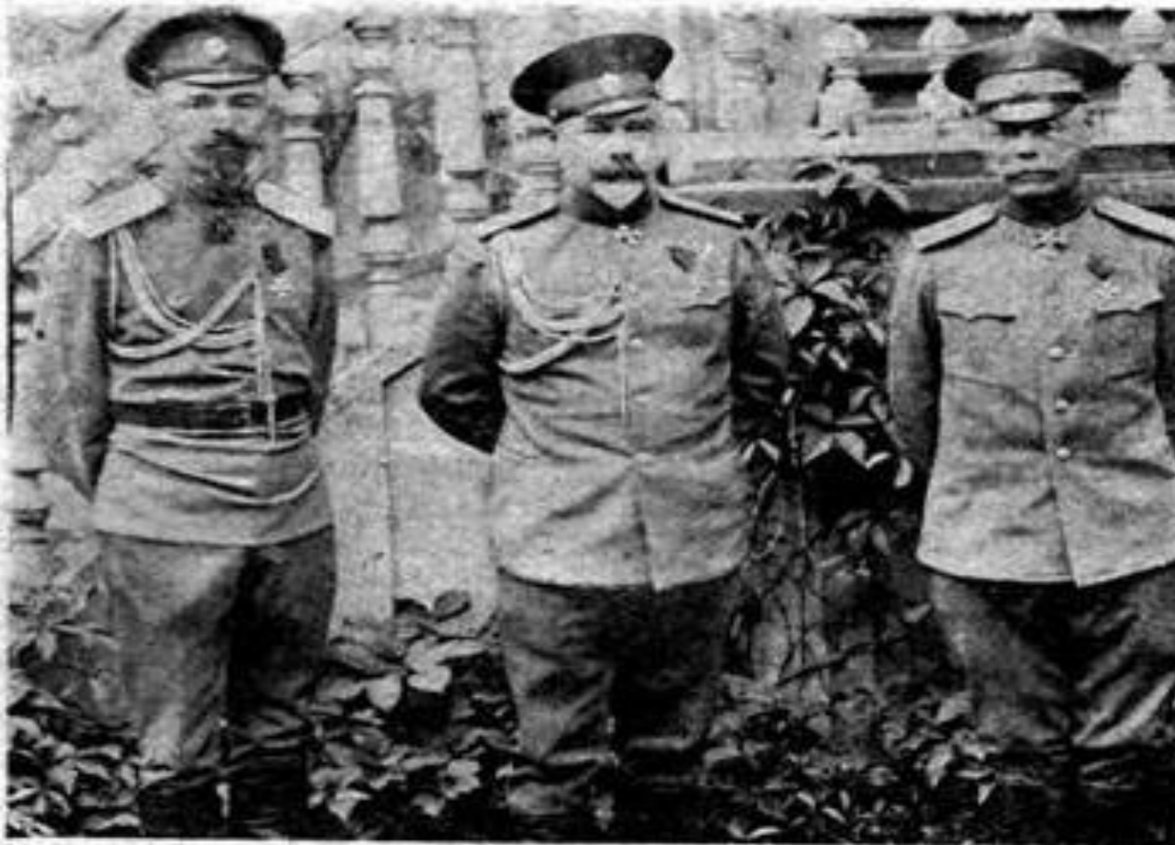
Вожди добровольческой армии: слева — ген. С. Л. Марков, в центре — ген. А. И. Деникин, справа — ген. М. В. Алексеев.