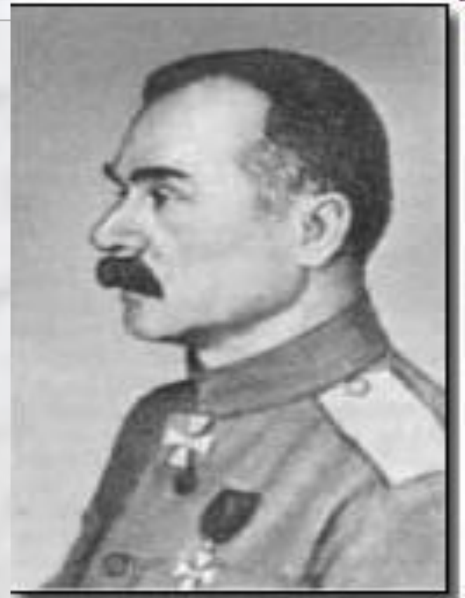
Атаман Войска Донского А. М. Каледин