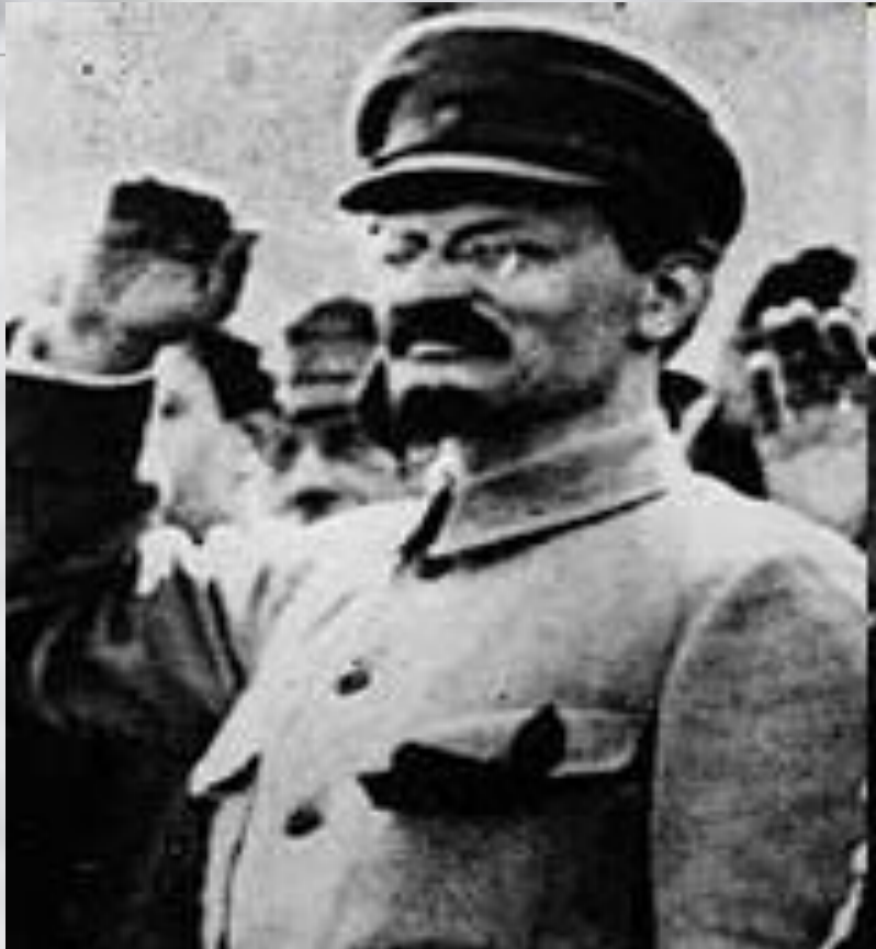
Один из создателей Красной армии Л. Д. Троцкий, 1917