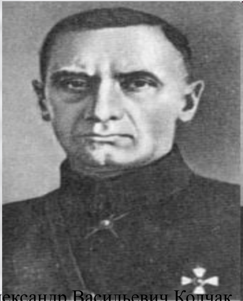
Александр Васильевич Колчак