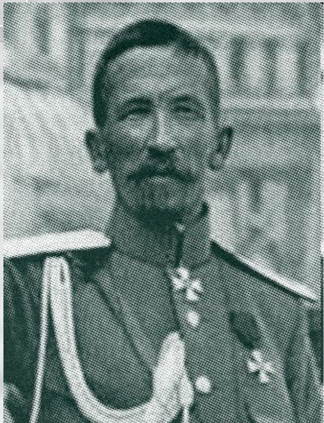
лидер Белого движения генерал Л. Г. Корнилов