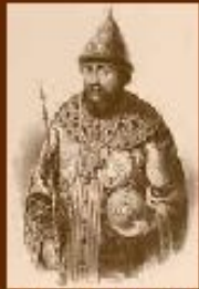
Алексей Михайлович 1629 - 1676