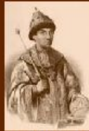
Федор Алексеевич 1661-1682