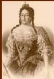
Анна Иоанновна 1693-1740