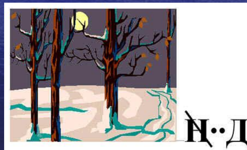
4. Ребус «ночь» н=д