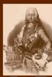
Петр III 1728-1762