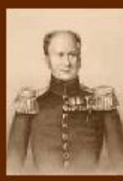
Александр I 1777-1825