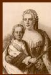
Иоанн VI 1740-1764