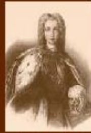
Петр II 1715-1730