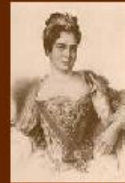
Екатерина I 1735-1781