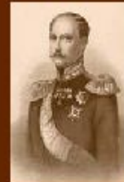
Николай I 1796-1855