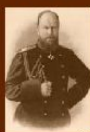
Александр II 1845-1894