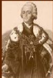
Павел I 1754-1801