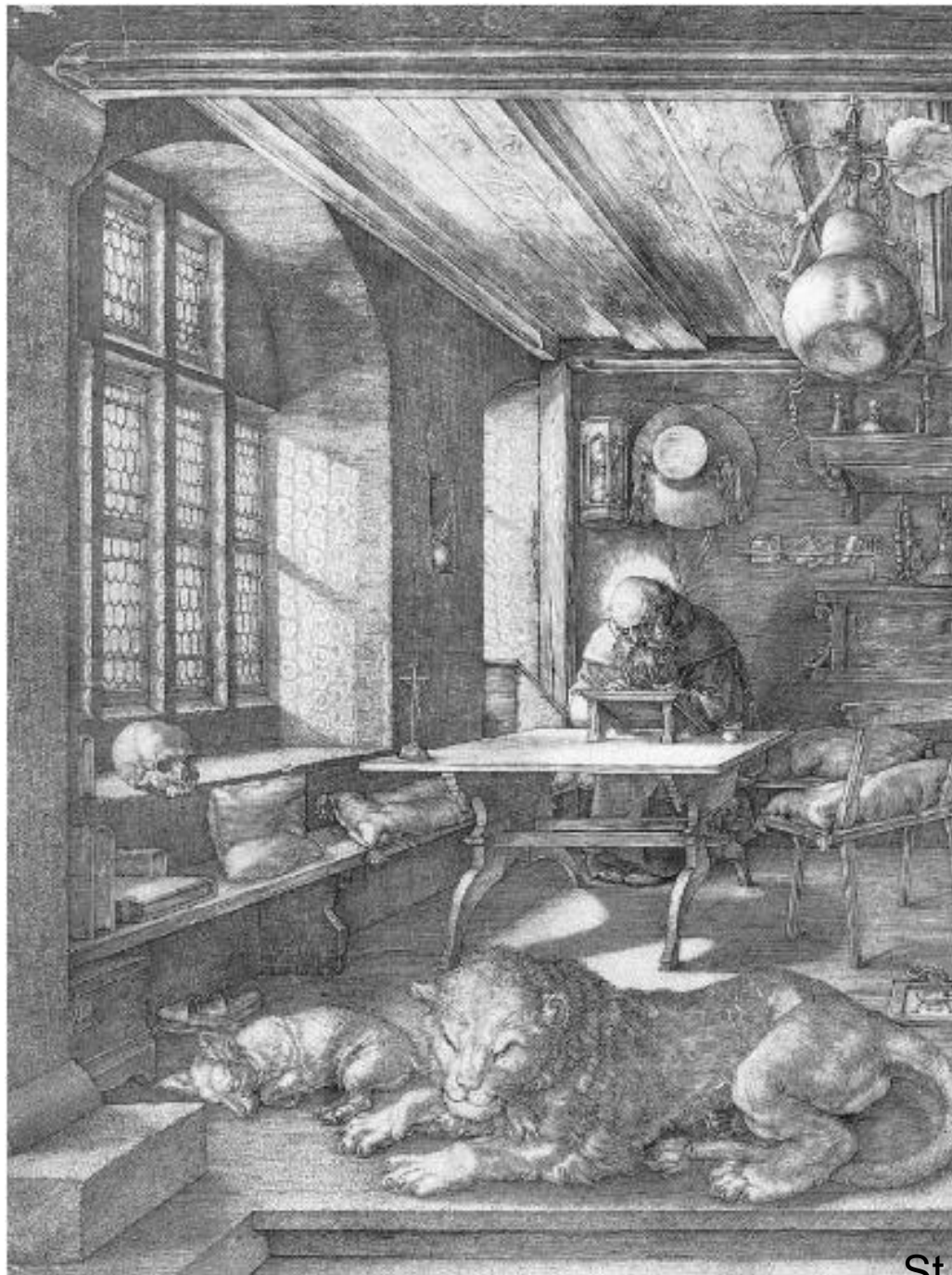
Albrecht Durer St. Jerome in his study