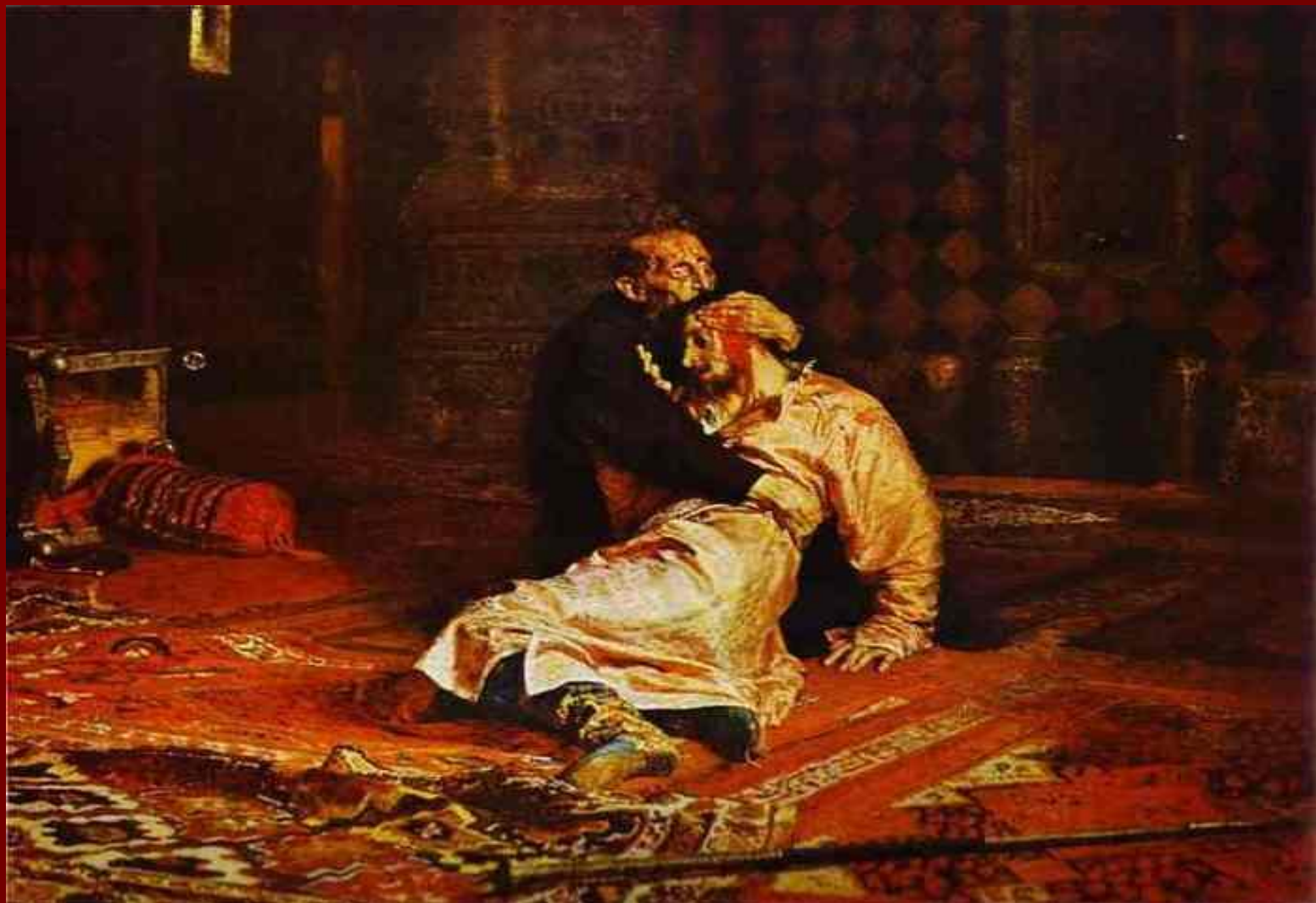
«Иван Грозный и его сын Иван 16 ноября 1581 года»