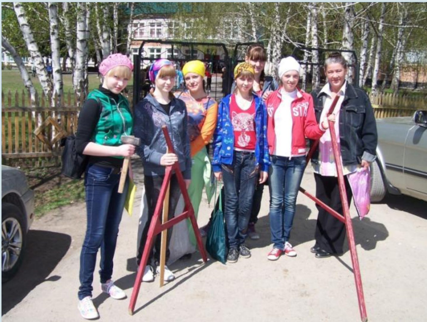
Участники команды «БЭД»