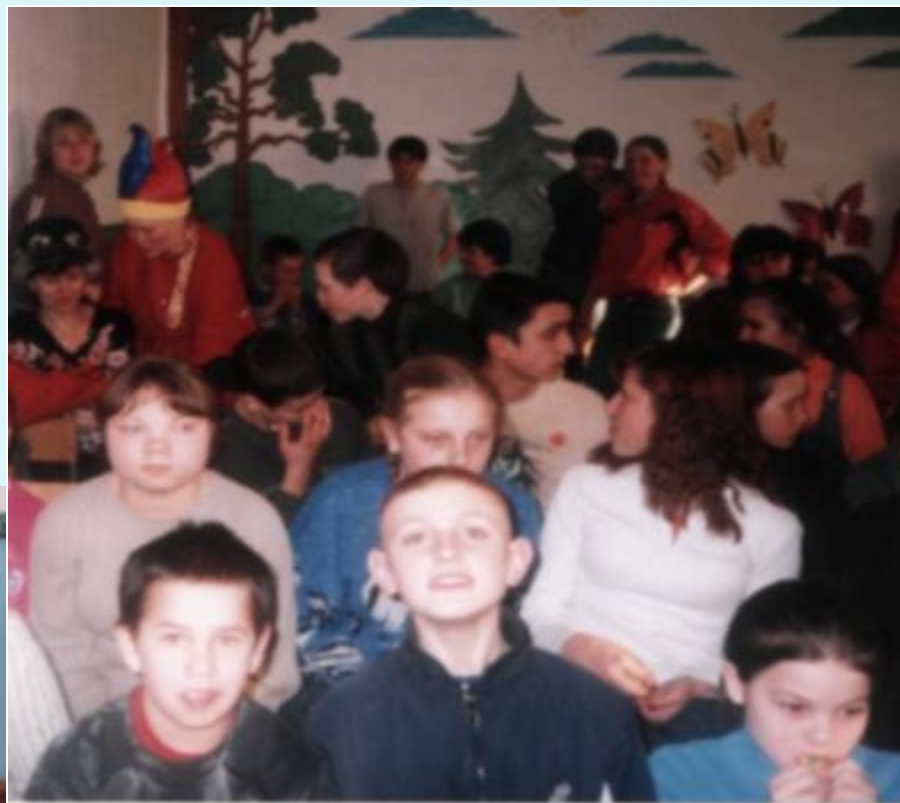
Скоморохи угощают гостей