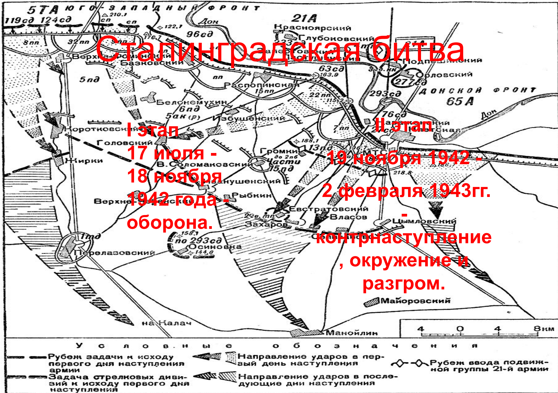
Схема 3. Группировка противника и решение командующего 21-й армией на прорыв обороны противника в битве под Сталинградом в ноябре 1942 г.