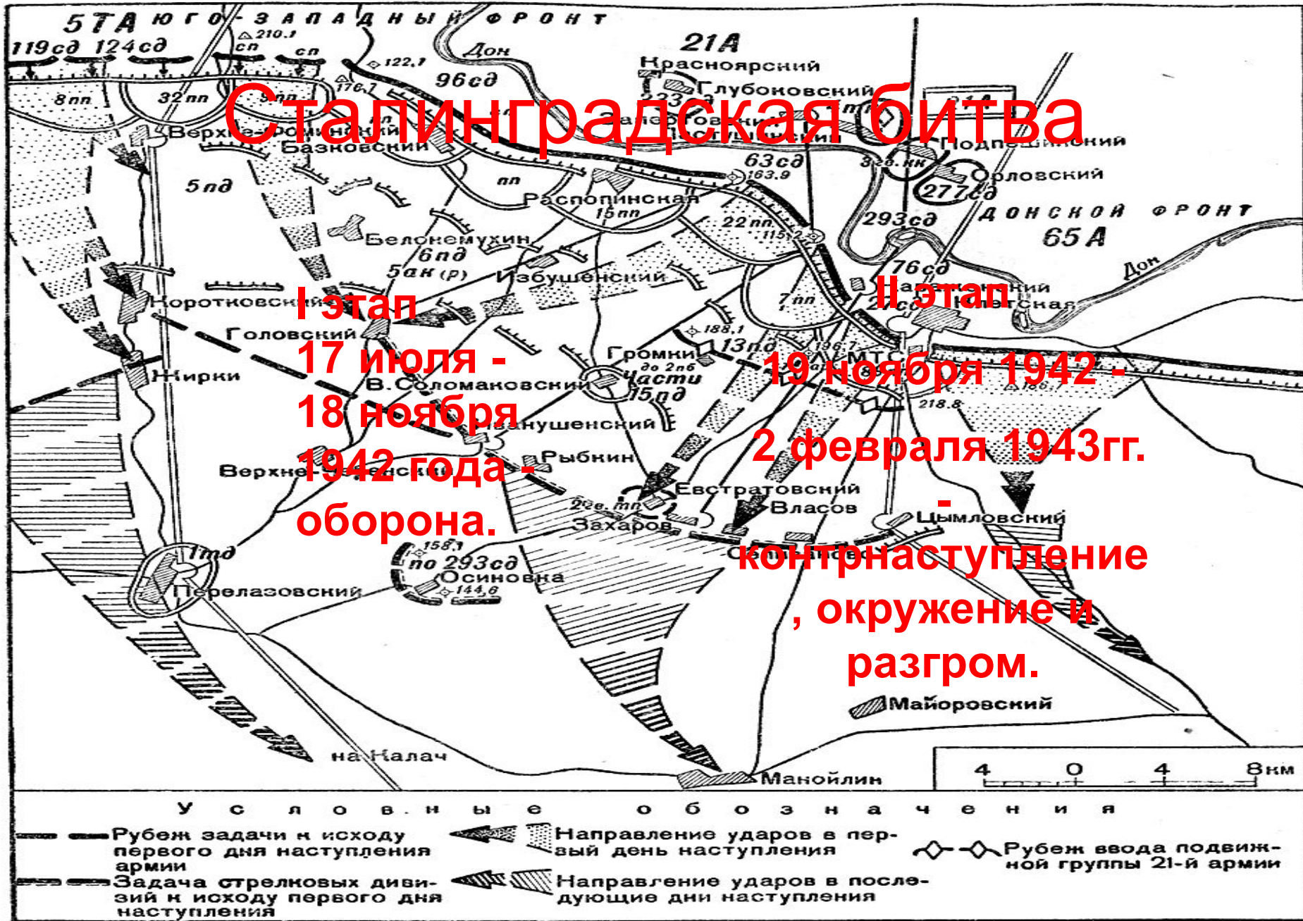
Схема 3. Группировка противника и решение командующего 21-й армией на прорыв обороны противника в битве под Сталинградом в ноябре 1942 г.