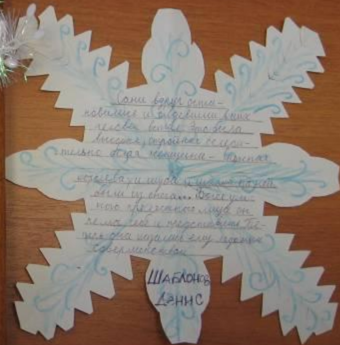
Шаблонов Денис 4А