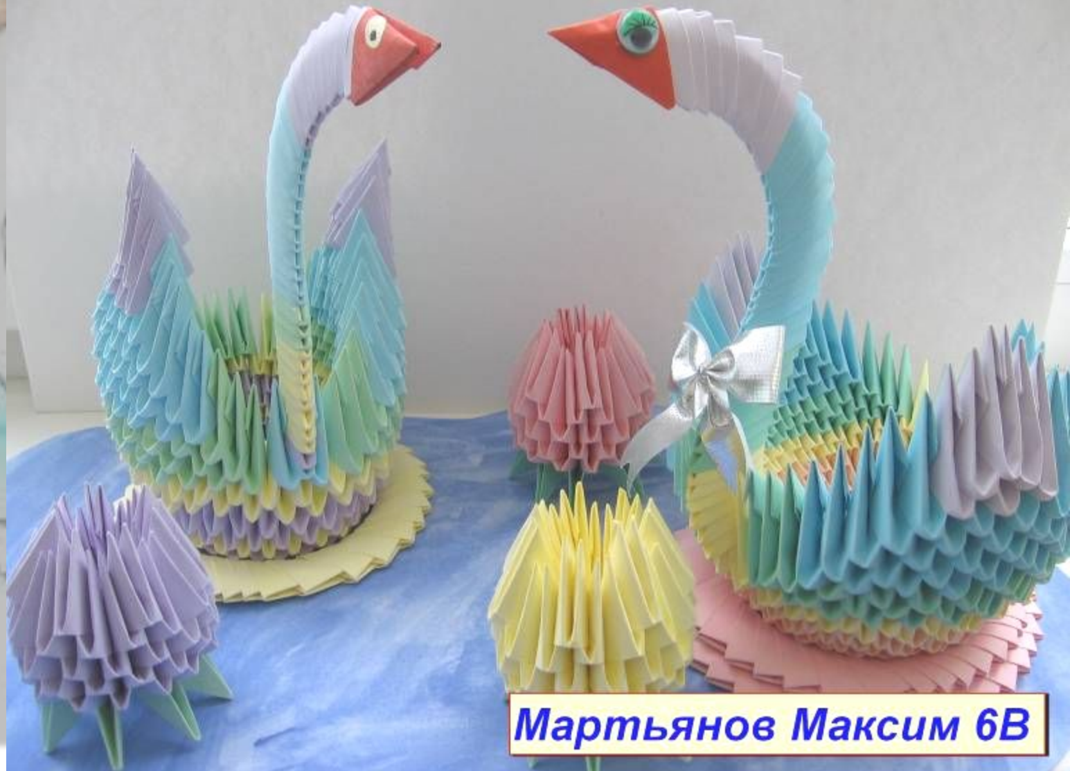
Мартьянов Максим 6В