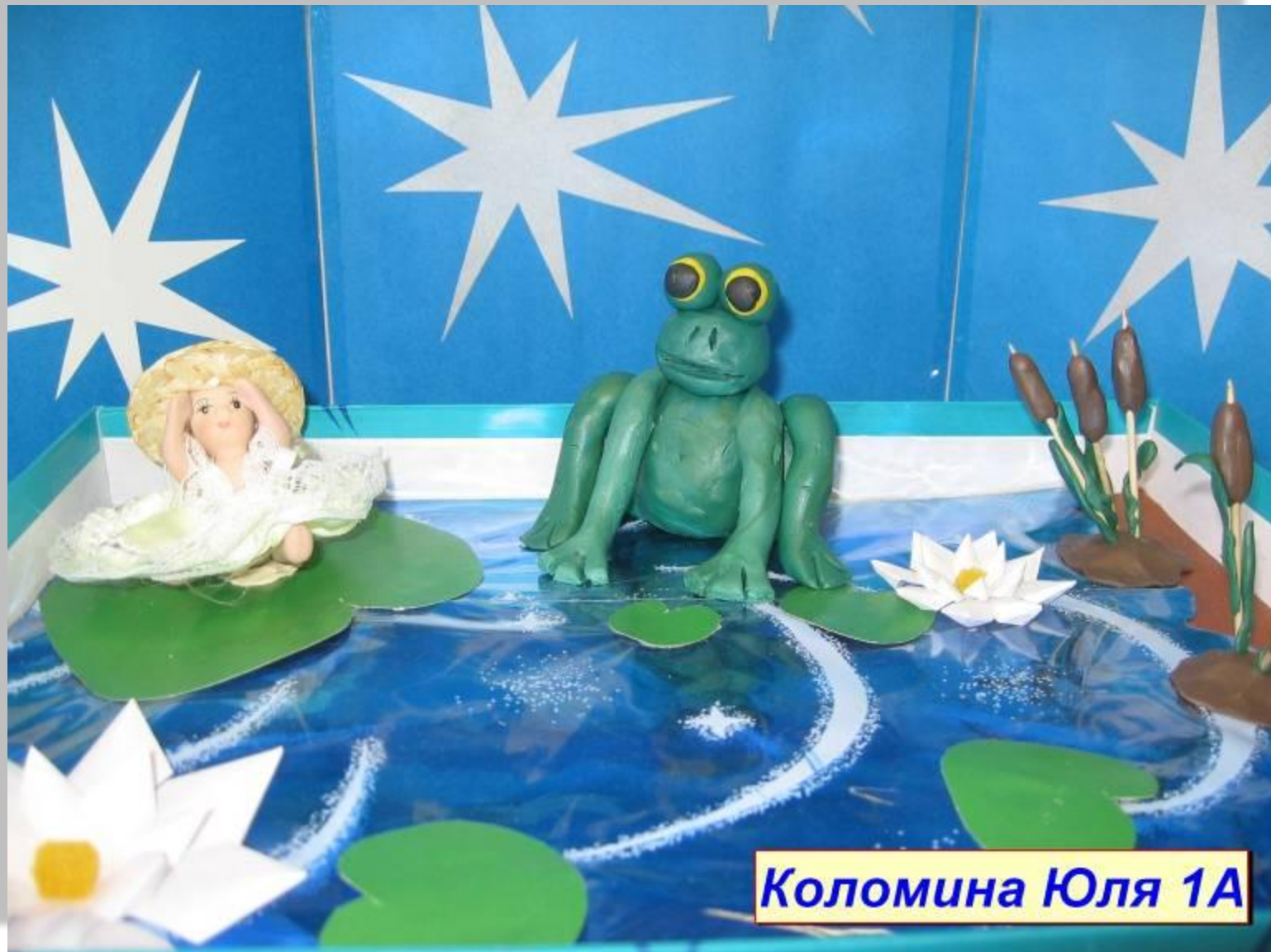
Коломина Юля 1А