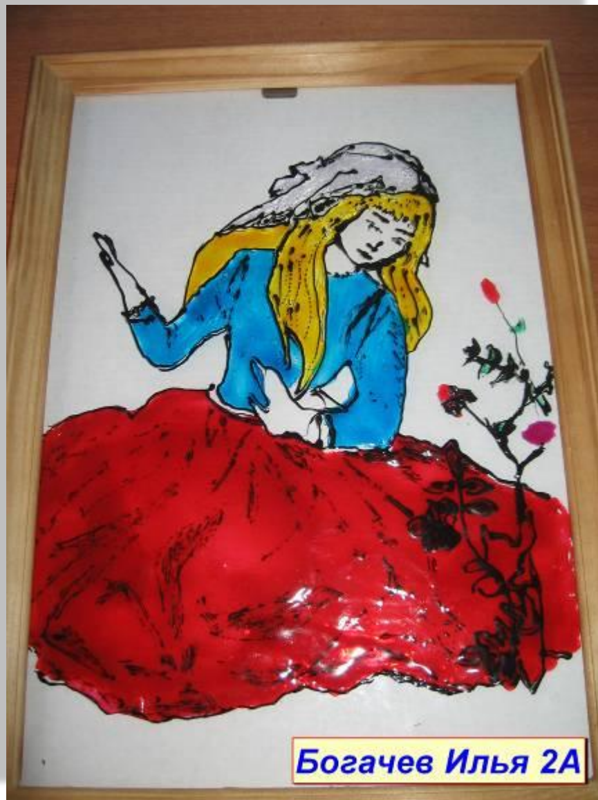
Богачев Илья 2А