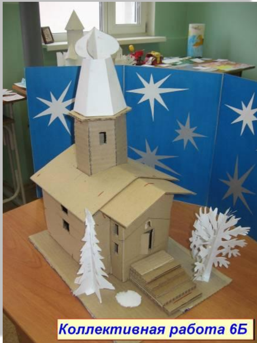
Коллективная работа 6Б