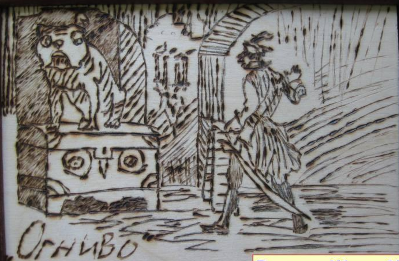
Власов Женя 6В