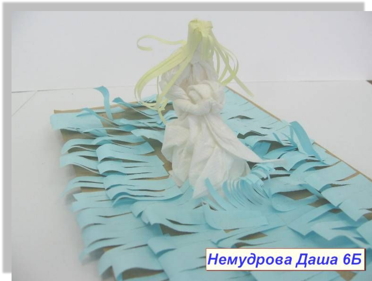
Немудрова Даша 6Б