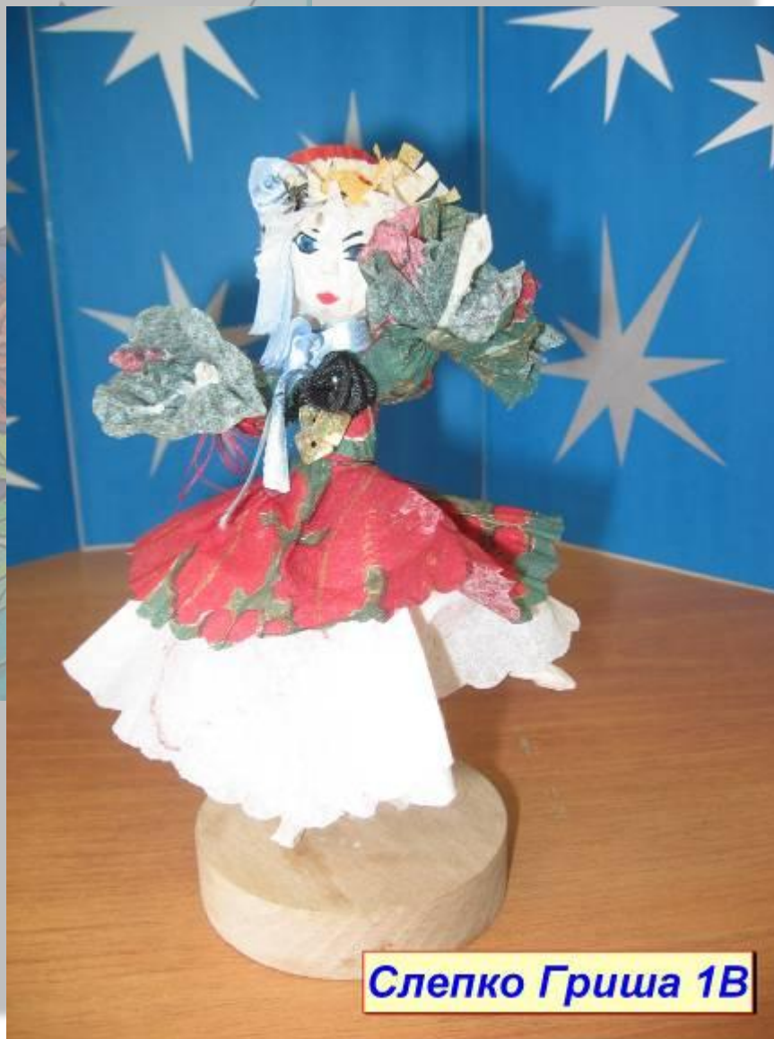
Слепка Гриша 1В