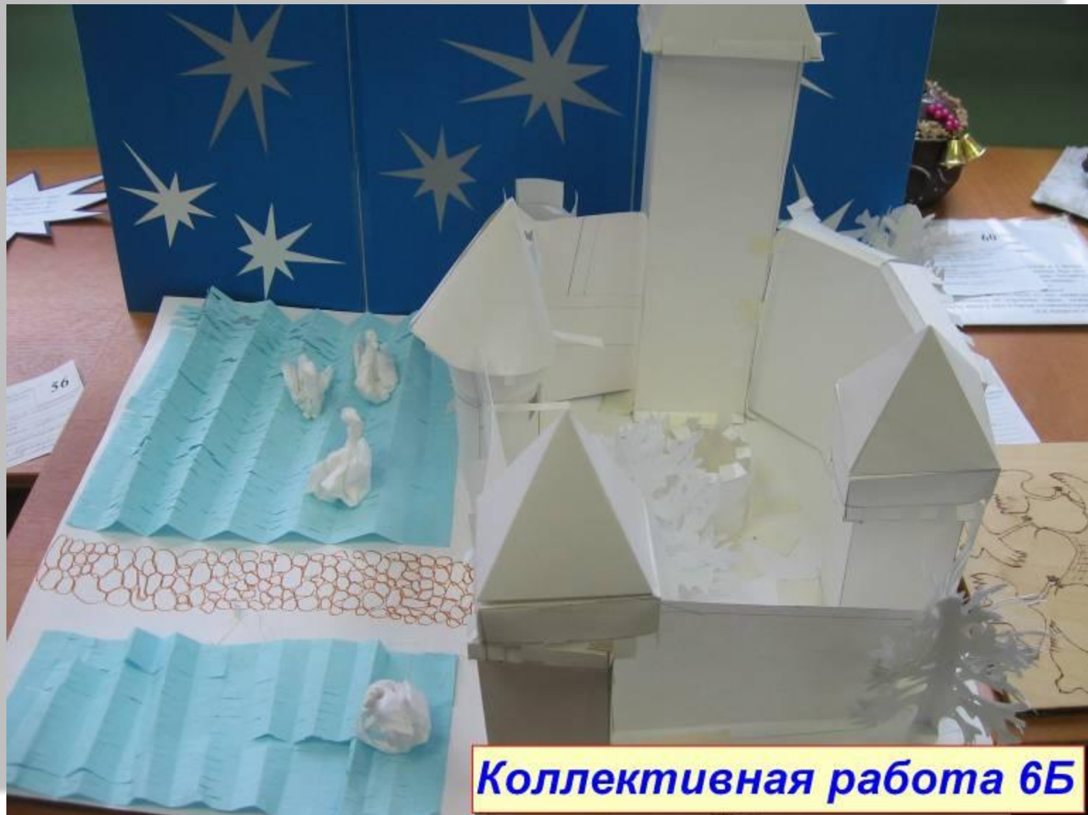
Коллективная работа 6Б