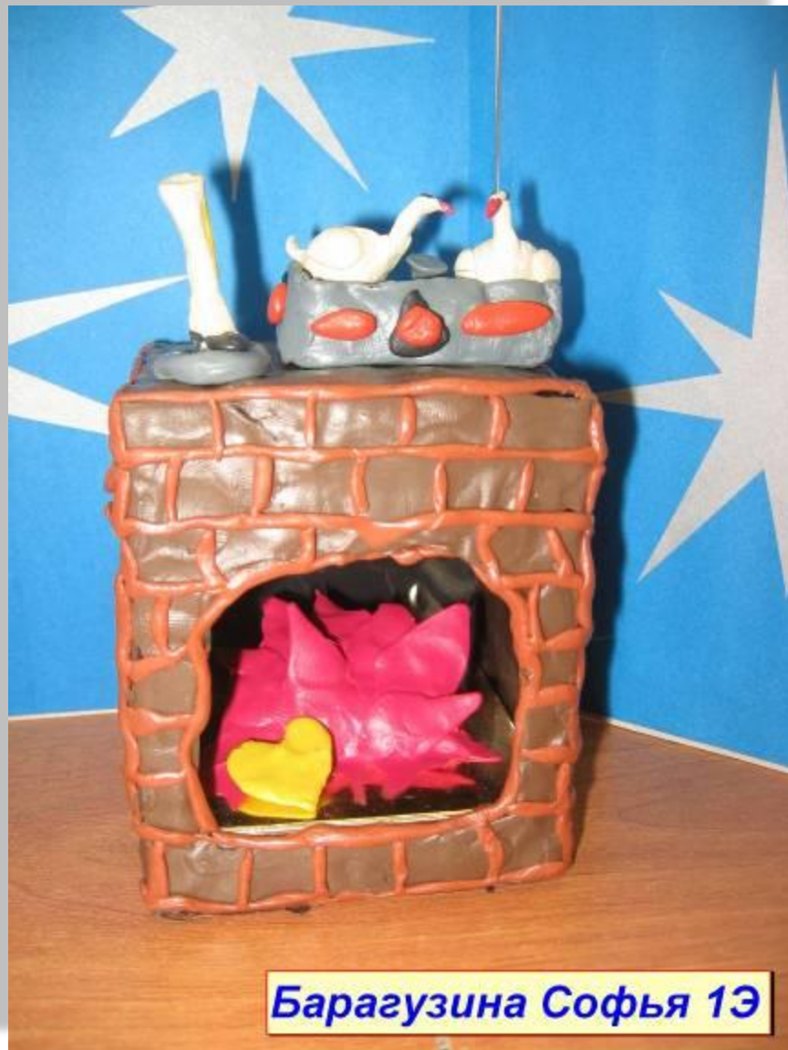
Барагузина Софья 1Э