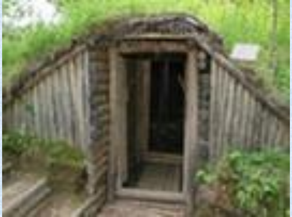
Вход в траншею

Зимовали скопом в траншеях, вырытых прямо в земле, Страшно мучили вши их – тиф разразился к весне.