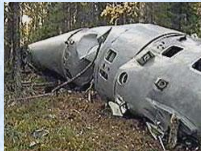
Отработанная ступень ракеты