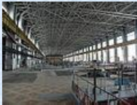
Объекты Сибирской АЭС