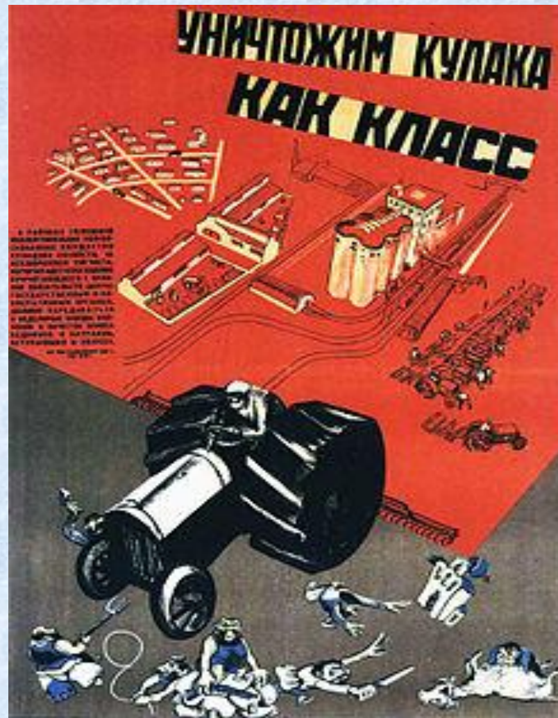
Плакат эпохи раскулачивания

Народ живёт здесь сильный, с суровой судьбой, Кто не хотел родниться с колхозною ордой.