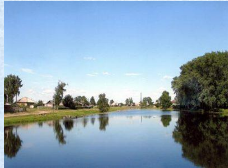
с.Бакчар, Центральный пруд

Той скромненькой речушки, что Галкою звалась, Куда в жару с подружками купаться я рвалась