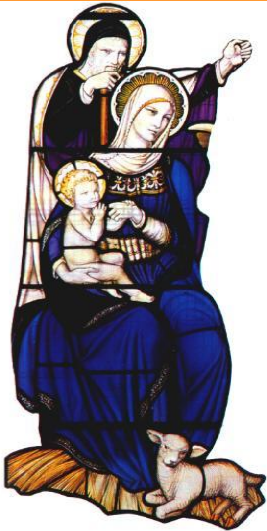
Святое семейство. Современный витраж.

Ок.5г.до н.э. В Палестине родился мальчик, став- ший впоследствии из- вестным под именем Иисуса Христа.