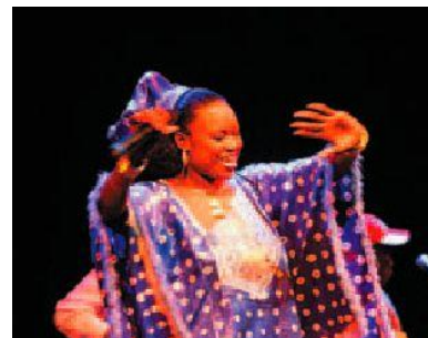
Искусство & Культура