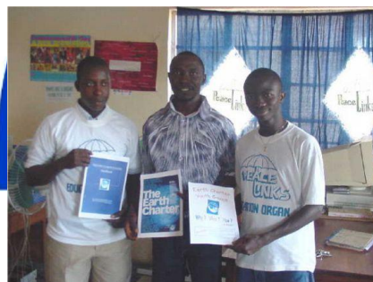
Активные Действия Молодежи & Помощь в Достижении Поставленных Целей