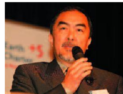
Интеграция Морально- Этических Ценностей в Бизнес