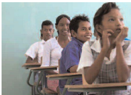
Образование для Устойчивого Развития