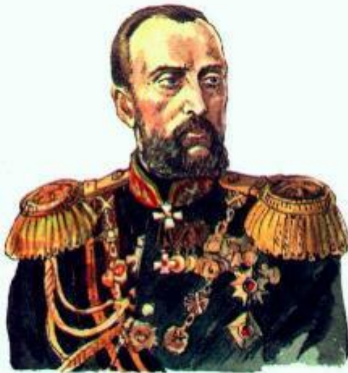
Николай Николаевич Главнокомандующий русской армии

12 апреля 1877 г. Александр II объявил войну Османской империи.