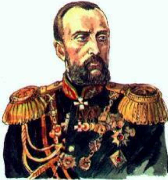
Николай Николаевич Главнокомандующий русской армии

12 апреля 1877 г. Александр II объявил войну Османской империи.