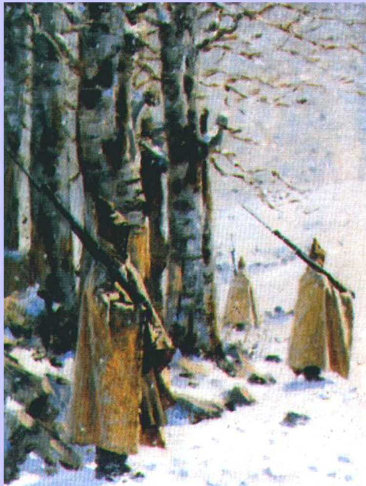
В.Верещагин Пикет на Балканах

Пока русское командование выясняло расположение своих отрядов, турки неожиданно ударили по Плевне и заняли город, создав угрозу для тыла русской армии.