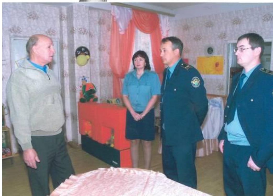
Вести из Молодежного центра

Шефство, помощь: Помощь от граждан и организаций поступает регулярно.