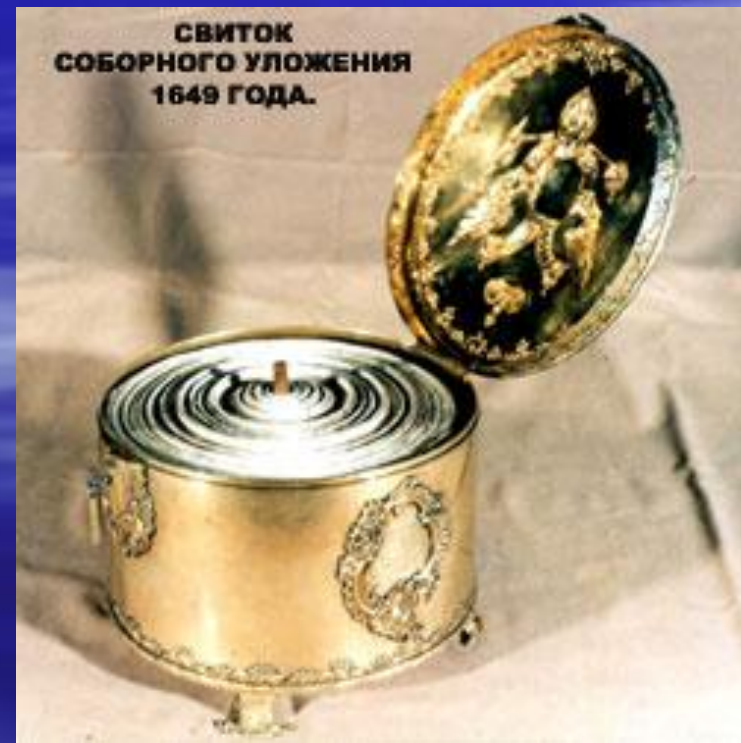
СВИТОК СОБОРНОГО УЛОЖЕНИЯ 1649 ГОДА.