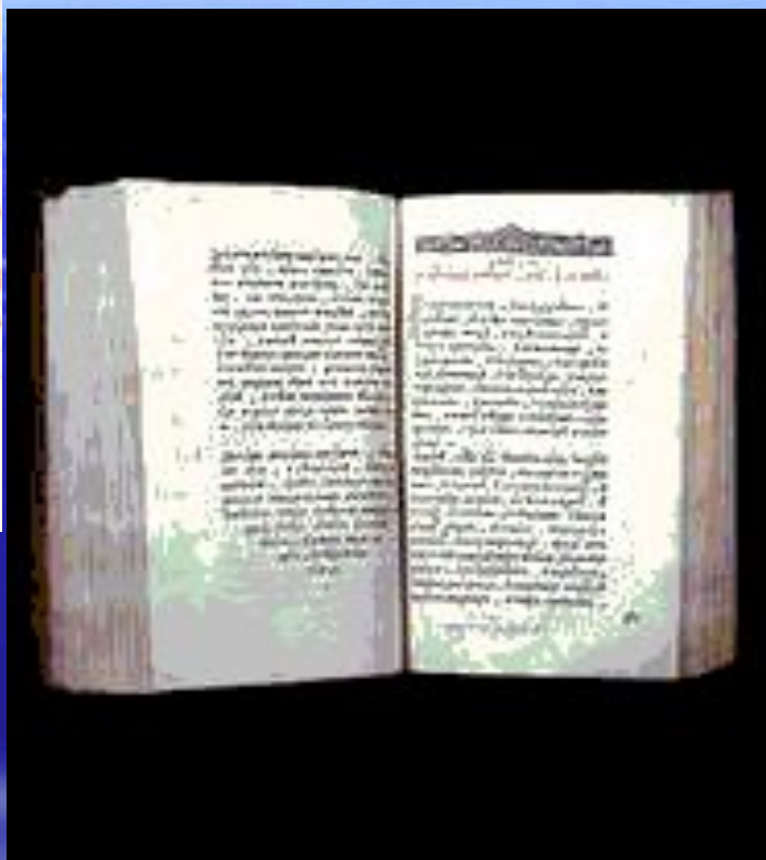
СОБОРНОЕ УЛОЖЕНИЕ 1649ГОД