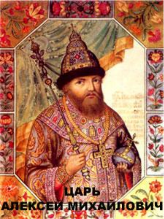
Царь Алексей Михайлович. Рисунок из книги «Титулярник». 1672.