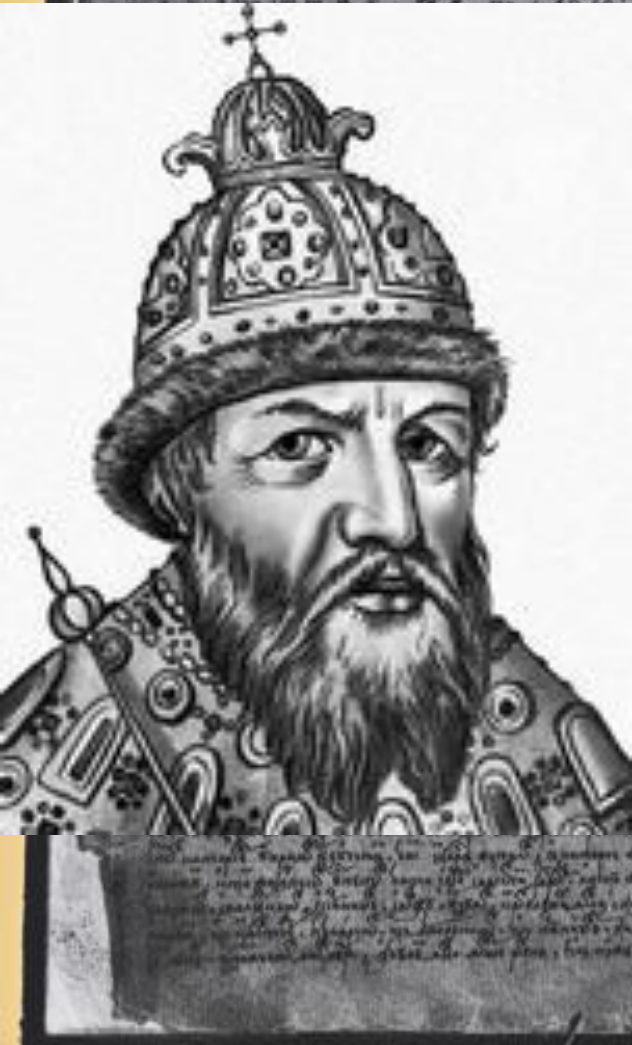
Иван IV Васильевич Грозный. Портрет из Титулярника изд. 1672