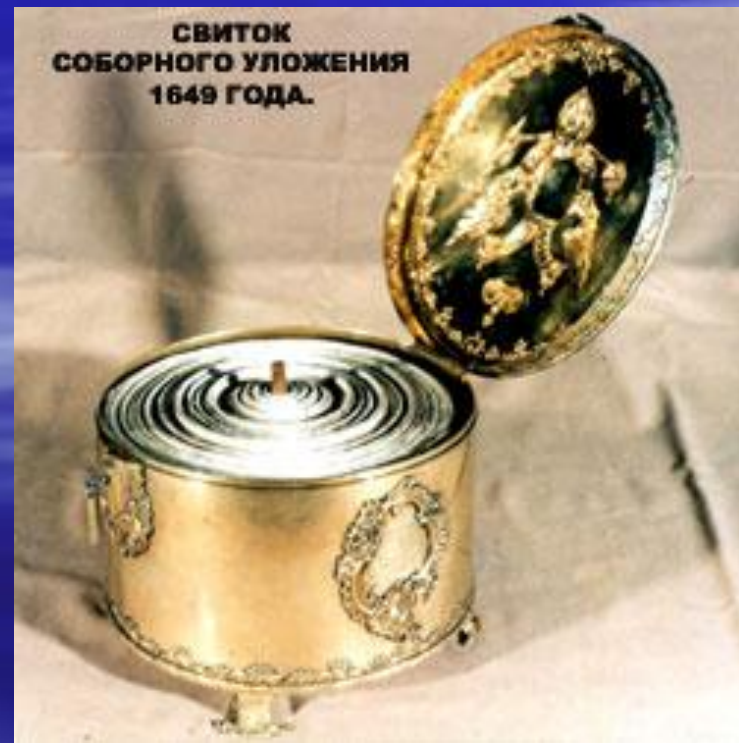
СВИТОК СОБОРНОГО УЛОЖЕНИЯ 1649 ГОДА.