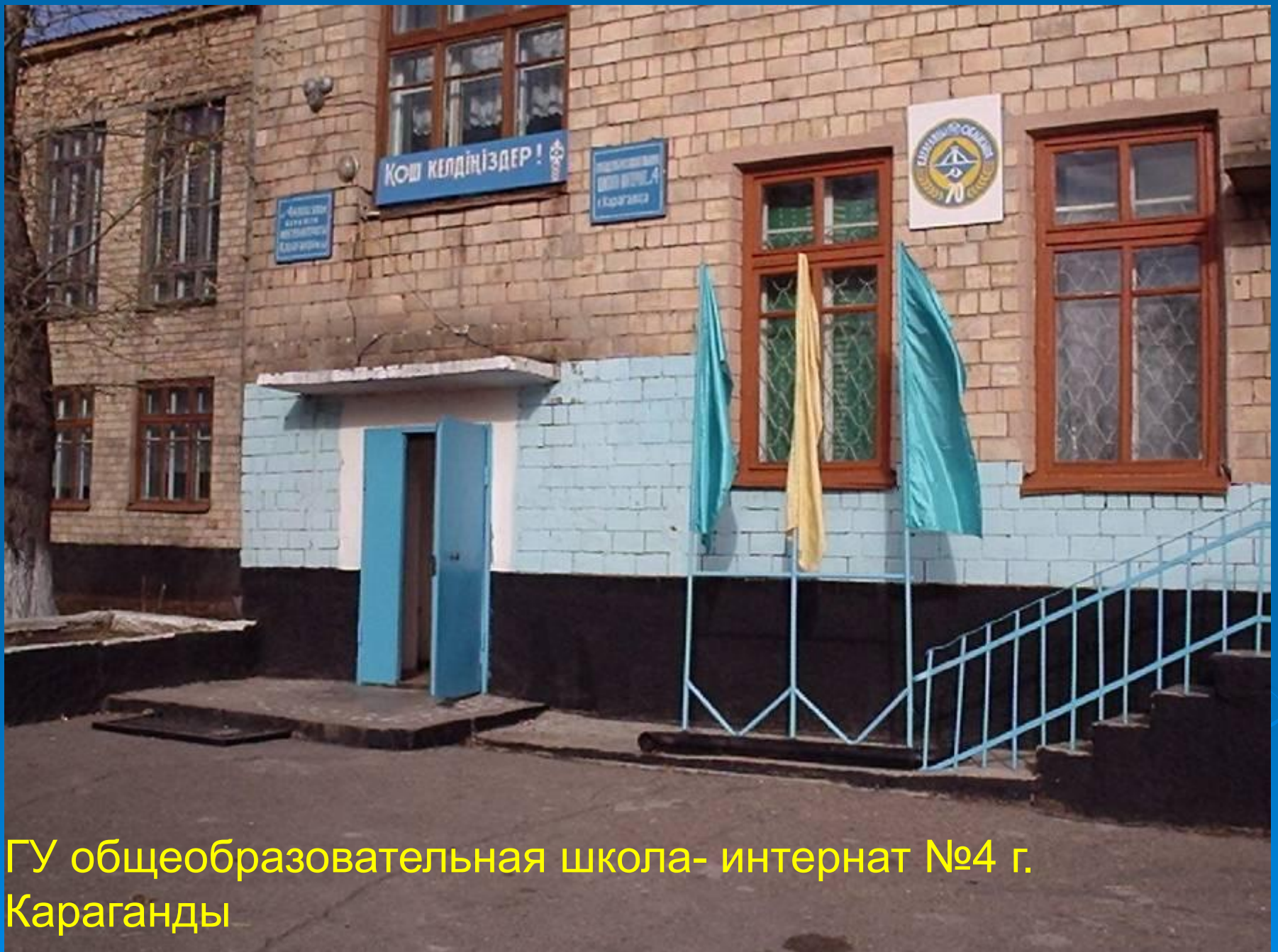
ГУ общеобразовательная школа- интернат №4 г. Караганды